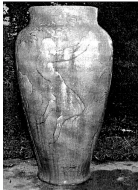
Az épen maradt Zsolnay-váza a faunnal

Szőnyegágyának nevezett pázsit vette körül a virágágyásokat, a pázsitot pedig csillagszerűen elágazó utak hálózta be. Az egész virágoskert rundókra