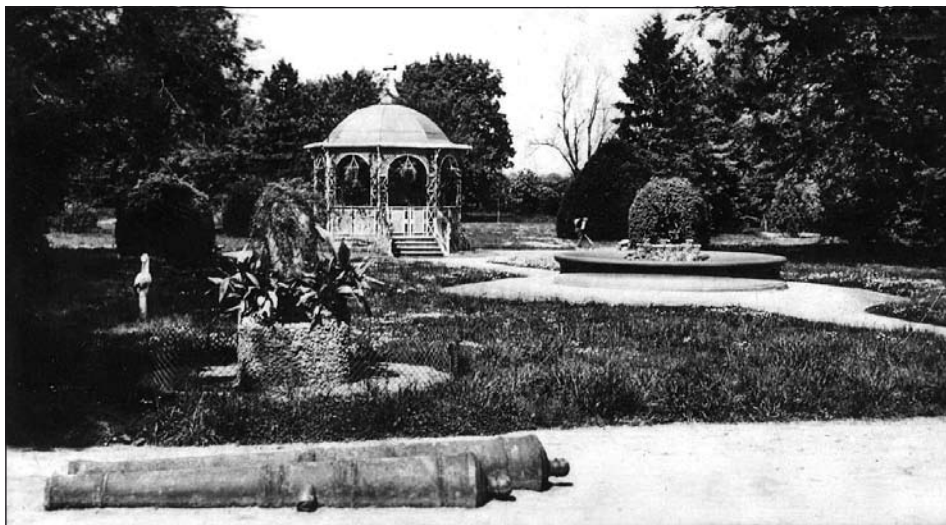
A péterváradai várba került ágyúpár feltehetőleg az 1940-es években készült felvételen, háttérben a saletli