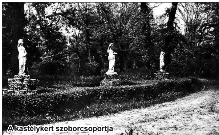
A kastélykert szoborcsoportja