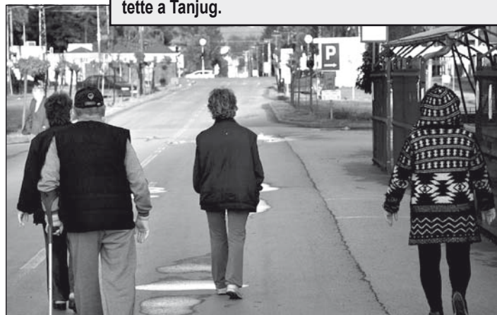
A 65 évesek és az ennél idősebbek viszont hosszú idő után elhagyhatták otthonukat