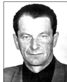
BALLA Ferenc (1926–1980)

Nem számít, hogy negyven év messzeség... Vannak emlékek, amelyek beleégnek a lélek szívárványhártyáiba, és szépségük, fájdalmuk változatlan és valós.