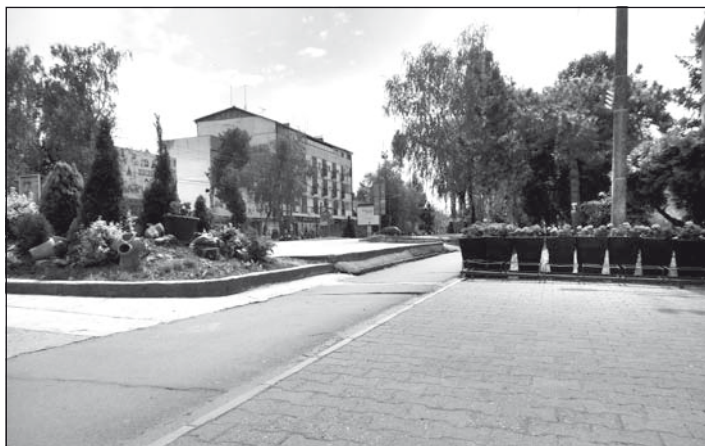
Temerin főutcája az utolsó nappali kijárási tilalom idején, pénteken. Egy lélek sem volt látható.

Választások júniusban lesznek, erről az államfő az ellenzék képviselőivel már tanácskozott, jelentette a Tanjug.