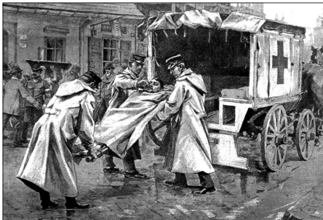
Kolerás betegek szállítása a századfordulón (korabeli rajz)

A XIX. század első felében, de különösen az 1831-es esztendő kíméletlen kolerajárványt hozott, amely több hónapra keresztül tartotta rettegésben őseinket és csak a hidegebb időjárás beköszöntével szűnt meg. Akkoriban még nem tudtak hatásosan védekezni a betegséggel szemben, habár egyszerű módszerekkel nagyban lecsökkenthették volna a halálos áldozatok számát (például az ivóvizet csak forralva kellett volna használniuk, a