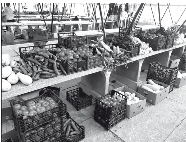
Az áru kirakva, kezdődhet a piac. Verebélyiek termékei.

– Mint minden mezőgazdasági ágazatban, itt is áldozatra van szükség ahhoz, hogy megmaradjon az ember. A zöldség-növény-termesztés kis területen is sok időt és energiát emészt fel. Az elvégzendő feladatokat nem lehet egy átlagos nyolcórás munkaidőbe besűríteni. Délelőtt és délután is el kell végezni a teendőket. Mindenkinek megvan a családban a saját munkabeosztása, ami sok esetben változhat is a nap folyamán, ezért alkalmazkodni is tudni kell. Sokszor plusz munkaerő alkalmazására is szükség mutatkozik. Egy-két napot tudunk csak előre tervezni, mert a munkánkat nagyban befolyásolja az időjárás is. Ez is egyfajta életforma, a legfontosabb, hogy szeressük azt, amit csinálunk.