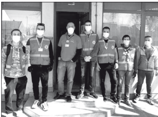
A Vöröskereszt aktivistáinak egy csoportja

sérülékeny személyeknek, vészhelyzetben életeket mentsen, terjessze a nemzetközi humanitárius jogismeretet. További felada-