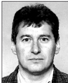
ifj. ILLÉS Péter (1962–2004)

Fájdalmas 16 éve, hogy elhunyt drága jó bátyám, sógorom, ke- resztapám és nagybátyánk