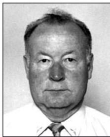
BUJDOSÓ István (1942–2019)