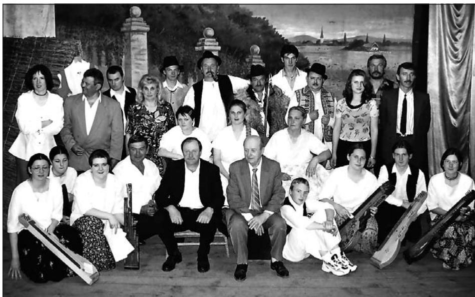
Húsz évvel ezelőtti felvétel, amely A lónak vélt menyasszony c. produkció után készült