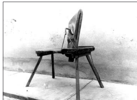
Sajátos szíjgyártó eszköz, a csikó