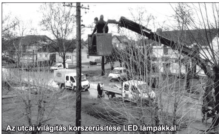
Az utcai világítás korszerűsítése LED lámpákkal

Szóba került az utcai világítás javításának kérdése is, amit elsősorban a nagy fogyasztású, régi típusú égők lecserélésével kíván megoldani az önkormányzat. Az eddig használt lámpák áramfogyasztása évente mintegy 25 millió dinárba kerül a községnek. Folyamatban van a régi típusú lámpák LED fényttestekre cserélése. Többen panaszkodtak, úgy tűnik számukra, hogy az utcák nincsenek eléggé kivilágítva, viszont a mérések az ellenkezőjét bizonyítják. A gondot valószínűleg az okozza, hogy az új lámpatestek a korábbiaktól eltérő fényt bocsátanak ki.