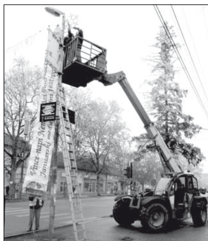
A borversenyt hirdető plakát felhelyezése a főutcán

A Kertbarátkör által eredetileg kistermelők számára szervezett rendezvényen ma már nagy pincészetek is részt vesznek. Szerbián kívüli, környező országokból is érkeznek mind borászok mind bírák. Az eseményt figyelemmel kíséri a sajtó, alább a Pannon tévé riportjából idézünk, amely a sajtótájékoztatón készült: