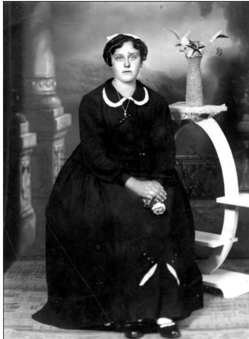
Egy kedves kép a dobozból

töztünk. Még most is emlékszem, hogy vonattal utaztunk, máig rejtelly, miért nem lovaskocsival hozott haza bennünket apó. Ő már itt várt minket, mindeközben földeket vásárolt, volt tehén, ló, a Kuszlitól szinte minden ránk maradt.