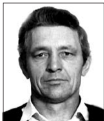
LACKÓ András (1943–2019)