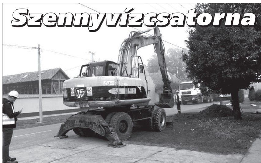
A napokban a Rákóczi Ferenc utcában folytatódott a szennyvízcsatorna építése

Kedves Szülők! A Szirmai Károly Magyar Művelődési Egyesületben újabb NÉPI ÉNEKCSOPORTOT INDÍTUNK. Elsős és másodikos gyermekek jelentkezését várjuk. Szakszerű tanítás, jó közösség és kirándulási lehetőségek adottak. Akinek felkeltettük az érdeklődését, a 063/125-86-42-es telefonszámon jelentkezzen.