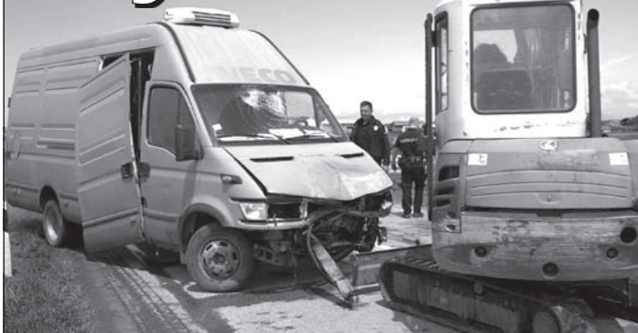
A baleset helyszíne (A Pannon RTV felvételei)

Személygépkocsi és furgon ütközött az elmúlt héten, szerdán a déli órákban Járek bejáratánál a körforgalmi út építésénél. Lapértésülések szerint a furgon előzés közben frontálisan ütközött egy Ford Escort típusú személygépkocsival. Az ütközés erejétől mindkét autó összeroncsolódott, a balesetben öt személy megsérült. A tűzoltók is segítettek a mentősöknek a négy sérültnek a Fordból való kiszabadításában.