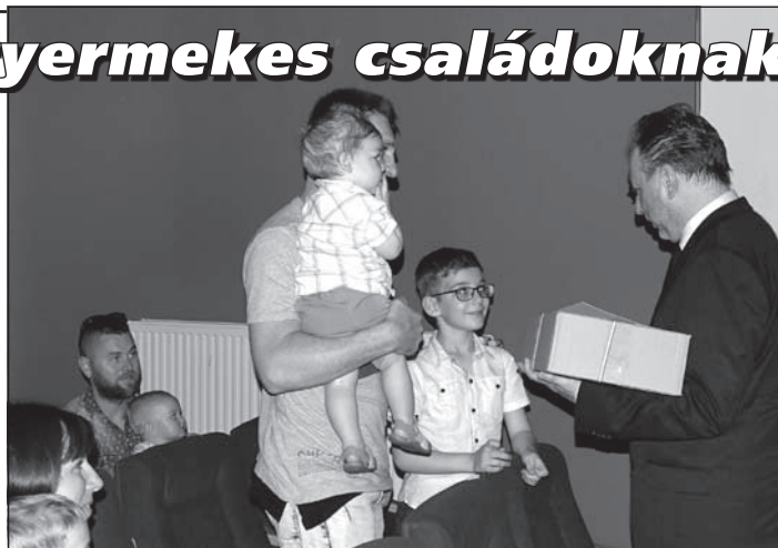
Fekete Péter államtitkár átnyújtja az ajándékcsomagot