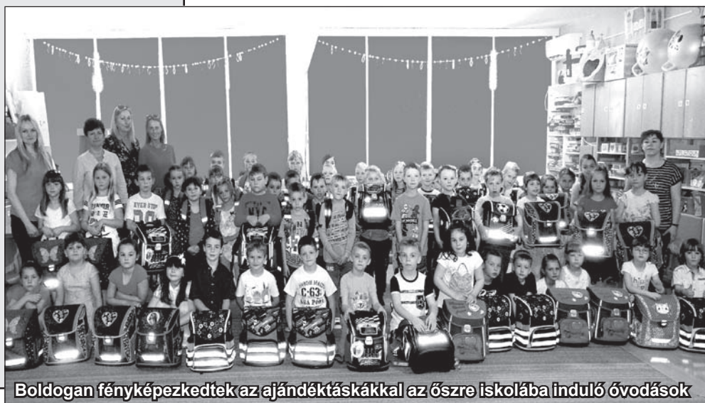
Boldogan fényképezkedtek az ajándéktáskákkal az őszi iskolába induló óvodások