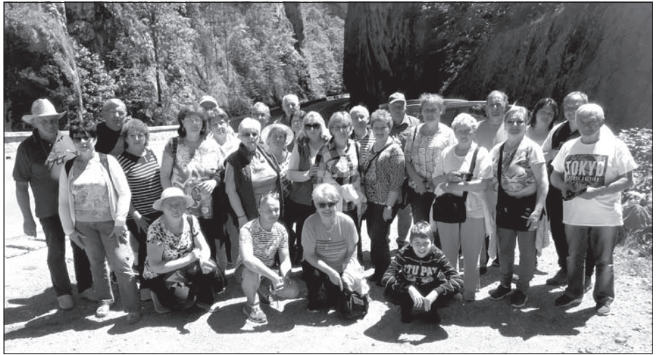
Csoportkép a Békás szorosnál

vek, és együtt imádkozva vártuk a Szentatyát több százezren. Igazi csoda történt. Az eső is elállt, mikor Ferenc pápa a helyszínre érkezett és üdvözölte a zárandokokat. Ennyi embert