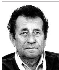
TÓTH István (1940–2017)