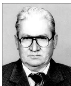
KOVÁCS István (1928–1994)