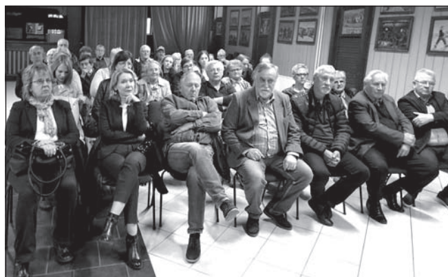
A közösségi találkozó résztvevői

ZARÁNDOKLAT A CSÍKSOMLYÓI BÚCSÚRA erdélyi körúttal egybekötve, valamint nyári kirándulást szervezünk a Székelyföldre Telefon: 063/84-83-070