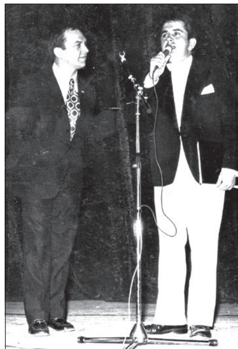
Bodrogi Gyula a szerzővel