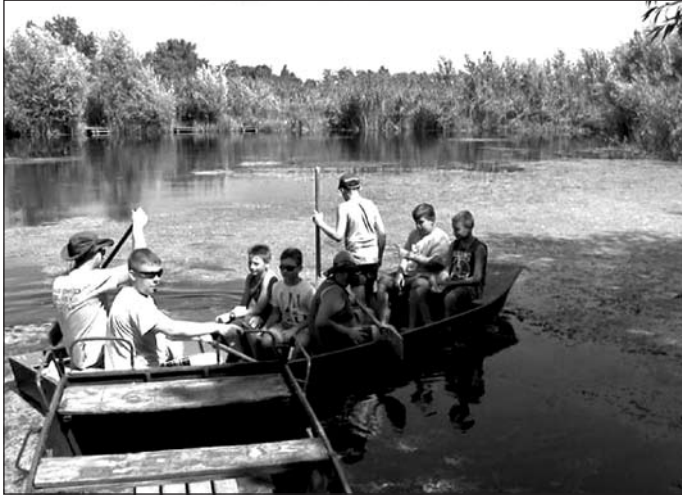
Fiatal természetbarátok a Jegricskán

Egyes növény- és állatfajok nemzetközi jelentőségűek. 1997 óta a Jegricska nemzetközileg jelentős madárélőhely – IBA (Important Bird Area), 2005 óta pedig nemzetközileg jelentős növényélőhely is, nemzetközi megnevezéssel IPA (Important Plant Area).