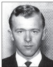
PÁSZTOR Miklóstól (1941–2019)