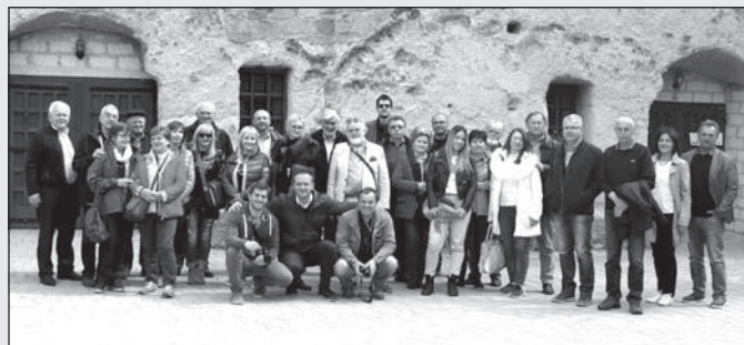
Szerbiai borászok csoportja a tufába vájt egri borpincék bejárata előtt