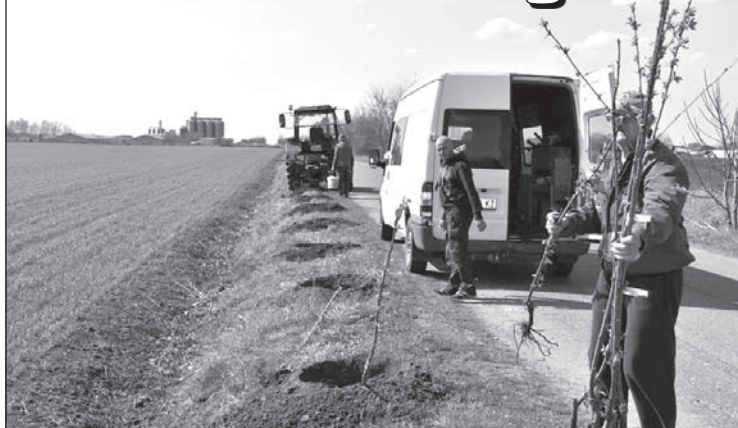
FENT: A Kertbarátkör tagjai a hét végén facsemetéket ültettek a Csúrogi út mentén