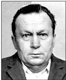
MÓRICZ Vince (1929–1989)

Április 6-án volt 30 éve és november 7-én lesz 4 éve, hogy nincsenek közöttünk szeretteink