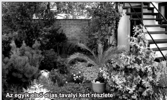
Az egyik első díjas tavalyi kert részlete