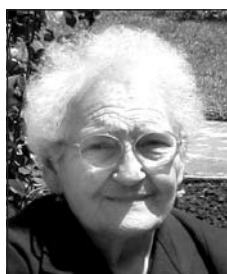
NOVÁK Borbálára (1927–2012)

Akiket szeretünk, s már a sírban nyugszanak, igazi nyughelyük a szívünkben marad. Bárhogy is múlnak az évek, a lélek nem feled, mert összeköt minket az örök szeretet.