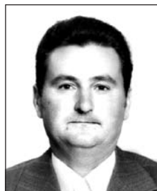
DÁNYI István (1937–2016)