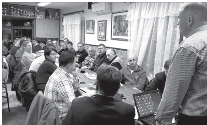
Juhász Attila a szépszájú érdeklődőnek a minisztériumi költségvetés gazdákat érintő részéről beszélt

Juhász Attila, a Mezőgazdasági, Erdő- és Vízgazdálkodási Minisztérium államtitkára elmondta, hogy a minisztérium 2019. évi költségvetése 51,7