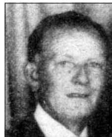
HORVÁTH István (1931–1990)