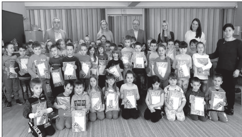
Közös kép az ősre magyar iskolába induló temerini gyerekekről