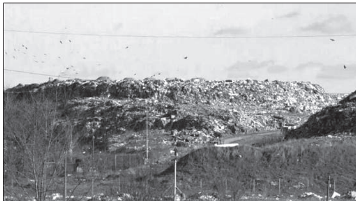
Emeletnyi magasra tornyosuló háztartási szemét Újvidék közelében