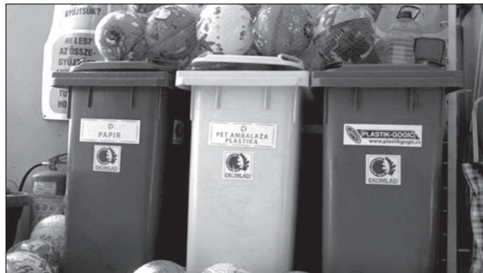
Hamarosan megkezdődik a szelektált szemétyűjtés? Kukák papirnak PET-flakonoknak és háztartási szemétnak

Egy kis tréfa • Egy kis tréfa • Egy kis tréfa • Egy kis tréfa