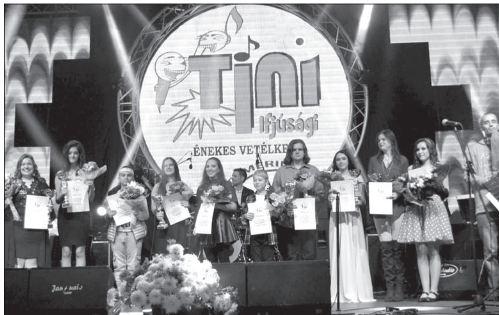
A 27. Tini és Ifjúsági Énekes Vetélkedő díjazottjai