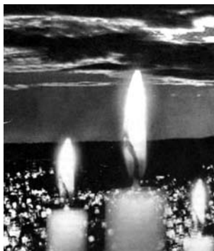
ÖKRÉSZ Imrére (1944–2004) aki 14 éve