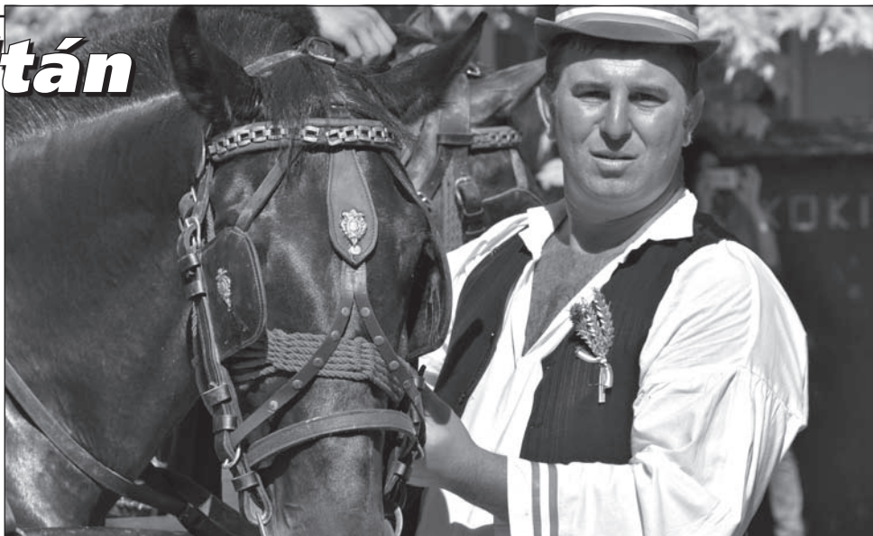
D A lovas és lova

Temerini embereket, eseményeket, épületeket fényképez kitartóan és magas szakmai színvonalon VARGA Zoltán az újvidéki Forum nyugalmazott dolgozója. Háttérfények, hibátlan képkompozíciók, elcseszett pillanatok teszik élvezetessé fotográfiáit. Megérdemelné talán egy kiállítást is. A rendelkezésre bocsátott többtucat felvételtől azokat válogattuk ízelítőként, amelyek temerini embereket és eseményeket ábrázolnak.