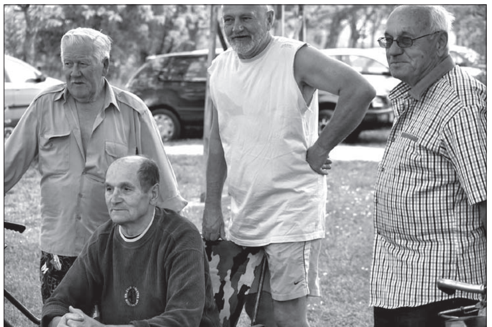
Kibicek 1.

A jelen szerv az értesítés 3. szakaszában említett határidőt követő 10 napon belül döntést hoz a javasolt projektum meglévő állapotára vonatkozó környezeti ártalom felmérésének szükségességéről, amelyről a nyilvánosságot időben értesíteni fogja.