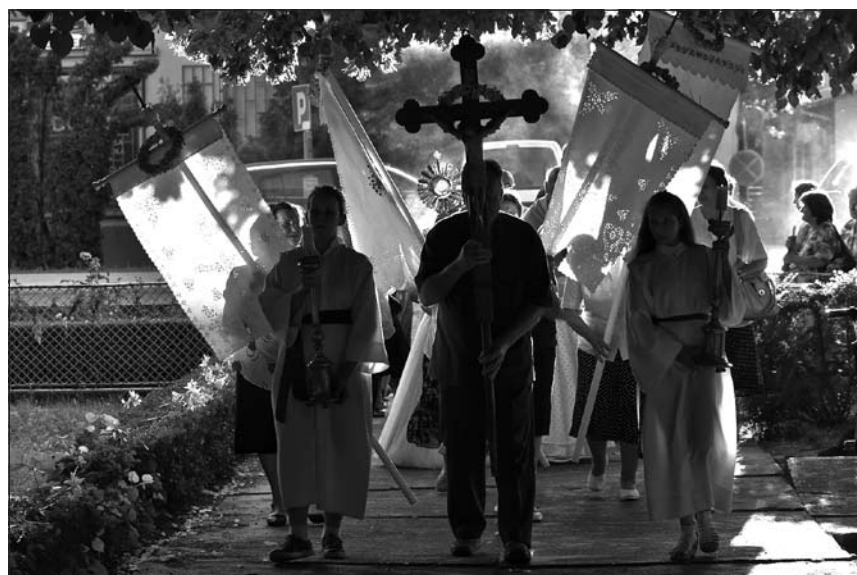
Úrnapi körmenet