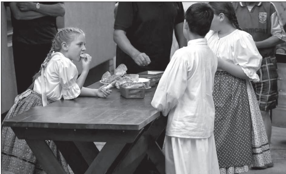
Kifli (V. Z. felv.)