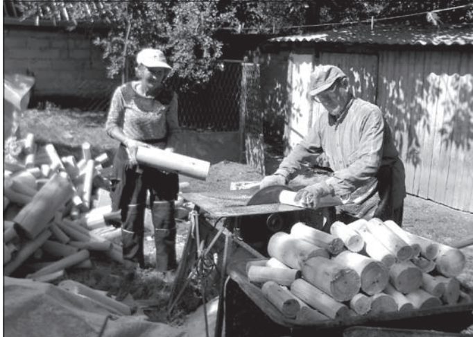
Tűzifának vágják fel az esztergált farönköket

– A körfűrészst egy vaslábakon álló asztalra szereltem, és vásároltam különböző fűrészla-