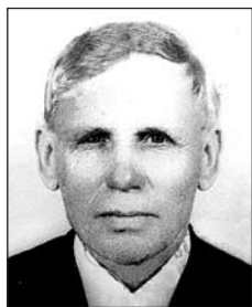
KOCSIS József (1914–1984)