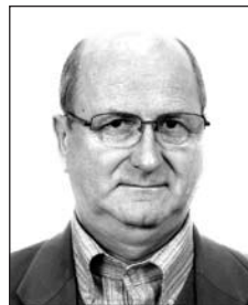
SZABÓ Lászlótól (1947–2018)

Virágerdő sűrűjében pihen egy szív csendesen. Virág, könny és csendes íma, ami e sírhantot körülfogja, álmok, emlékek, szép szavak, ez mind ami a múltból megmaradt. Szívünkben emléke örökké él.