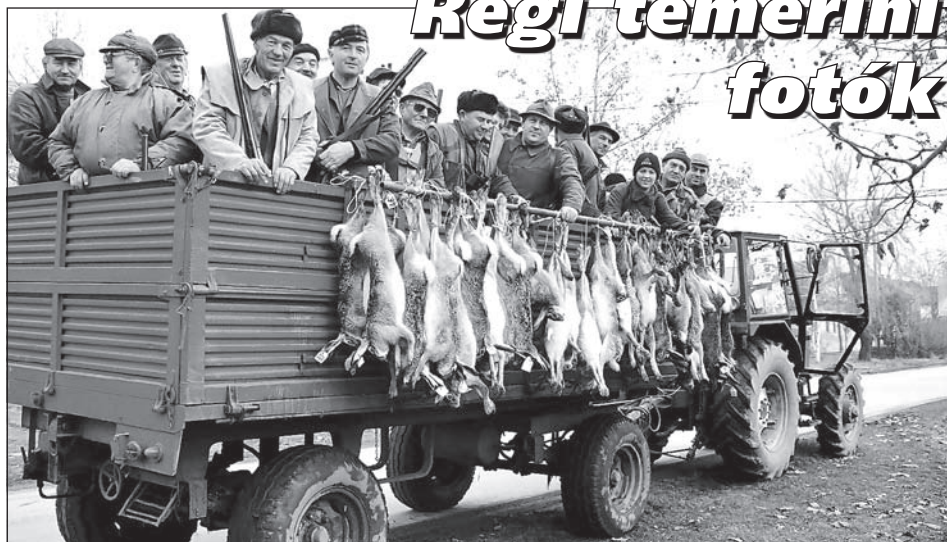
Amikor a fenti felvétel készült, még volt nyúl a temerini határban. A képen temerini vadászok egy csoportja az ezredforduló tájékán.