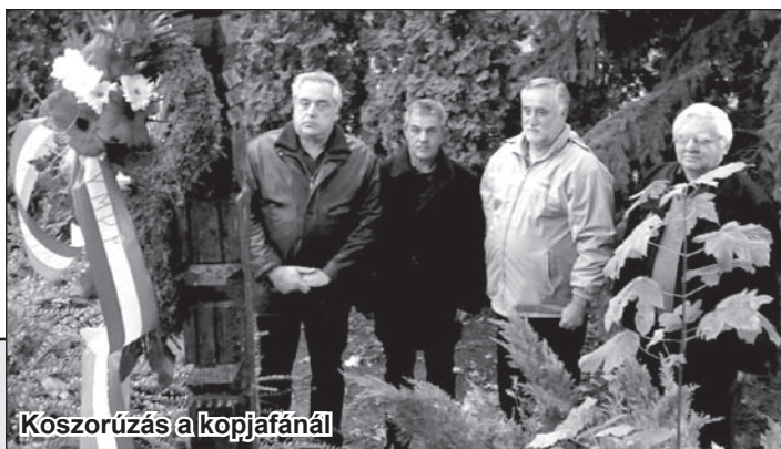
Koszorúzás a kopjafánál

nyűbb büntetés így Vécsey Károly grófnak jutott osztályrészül, neki ugyanis végig kellett néznie társai halálát; miután ő már senkitől nem tudott elbúcsúzni, kivégzése előtt a halott Damjanichnak csókolt kezét. A 13 mártír honvédtiszt a szemtanúk szerint bátran állt hóhérai elé, akik elrettentésül estig kinn hagyták a holttesteket. Számításaik nem váltak be, ezzel a lépéssel ugyanis csak azt érték el, hogy a közeli falvakból több ezren zarándokoltak a vesztőhelyre. Batthyány Lajost ugyanezen a napon, Pesten az esti órákban, az Újépület zárt udvarán állították kivégzőosztag elé, majd a ferencesek belvárosi templomában helyezték végső nyugalomra.