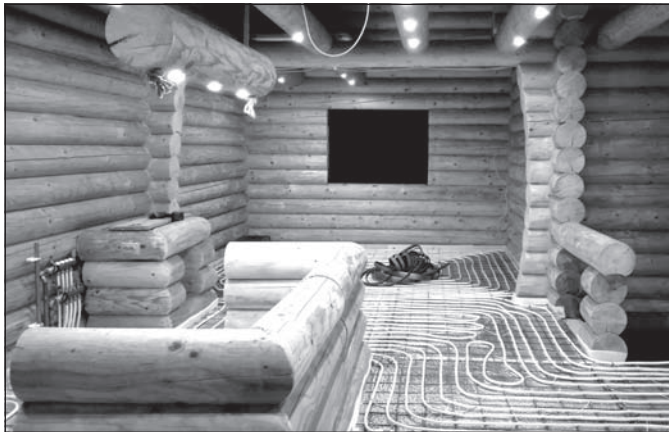
Az épület emeleti beltere

– Mindig is rajongtam a természetért. A feleségem erdélyi és ő az, aki méginkább felélesztette bennem ezt a rajongást. Frissházásokként anyagilag nem jutott mindenre. Jó lett volna minden évben meglátogatni a családját és tengerre is eljutni, de mivel ez akkor nem volt kivitelezhető, összekötve a kellemest a haszonnal, éveken át Erdélybe mentünk nyaralni. Ott láttam először rönkházat, de akkor még csak nézegettük, csodáltuk őket. Egy alkalommal végül kibéreltünk egy ilyen épületet, onnan jártuk körbe