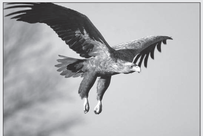
A ritka rétisas megfigyelése mindig nagy élmény. Az idén két példányt sikerült megfigyelünk a becsei halastavon.

nak. Az európai koordinátor, miután kiértékelte az összes résztvevő ország beküldött adatait, közzéteszi az eredményeket, és meghirdeti az egyes kategóriák győzteseit. Kíváncsian várjuk!