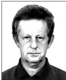
id. TISZTA Zoltántól (1953–2017)