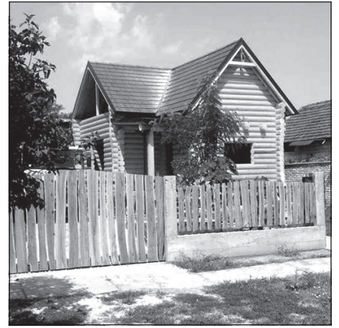
A rönkház kívülről

– Kétségtelen, hogy a faszervezetű házaknál mindig felmerül a tűzbiztonság kérdése, de ez a probléma a legtöbb ingatlan esetében ugyanígy felvetődik. Sokan azt gondolják, hogy a faházak pillanatok alatt a lángok martalékává válnak. Am a helyzet az, hogy a faszervezetű épületeken a láng lényegesen lassabban terjed, mint például egy olyanon, amelynek alumínium a szerkezete. A fa rendkívül rossz hővezető. Tény viszont az is, hogy a téglafal meg sem gyullad – hangszülőzza beszélgetőtársunk.