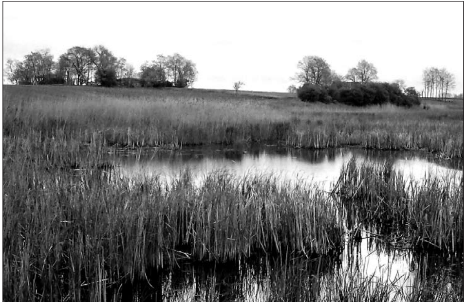
Tanyák a Tullabarán, az Újhíd közelében. Felvétel az 1970-es évek elejéről, a Temerini Újság archívumából