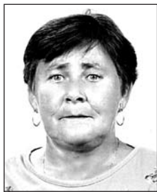
DUSÁNÉ OLÁH Esztertől (1953–2017)

Az igazi könnycsepp nem az, ami a szemünkből hullik, és végigcsorog az arcunkon, hanem az, ami szívünkből hullik, és végigcsorog a lelkünkön.