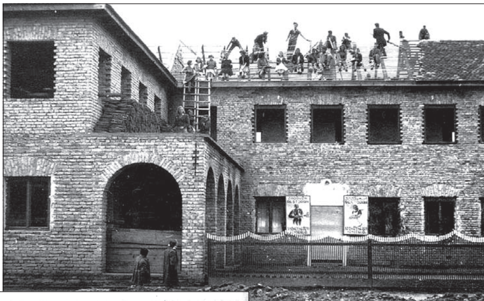
1952 – A szövetkezeti otthon („Dom”) cserepezése

A korábbi bejelentések értelmében hamarosan ismét napirendre kerül Temerin Község városrendezési terve. Ennek apropóján közlünk két régi temerini fotót, amelyek az egykor szövetkezeti otthonnak nevezett épület építési munkálatait mutatják be.