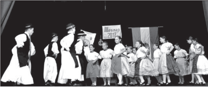
A Kőketáncban ezüst minősítésben részesült Rece-vice néptáncscsoport is fellépett az Illés-napi rendezvényen

A Szirmai Károly Magyar Művelődési Egyesület ezúttal köszöni meg a Magyar Nemzeti Tanácsnak és a Temerini Első Helyi Közösségnek a támogatást, amelyet az Illés-napi rendezvények megszervezéséhez nyújtottak.