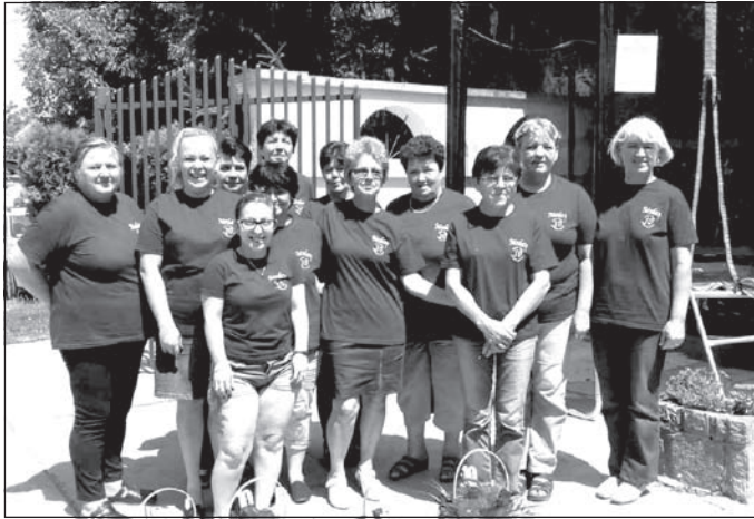
Egy emlékfotó a munkásnőkről, amely a Moda varroda megalakulásának 10. évfordulója alkalmából készült

• Hogyan került sor a cégalapításra, mi volt az indíttatás? – Én szakmabeli vagyok, az Ugledban dolgoztam 22 évet, utána pedig több magántulajdonú varrodában is. A fizetés sokszor rendszertelenül érkezett, meg másféle hanyagság is akadt.