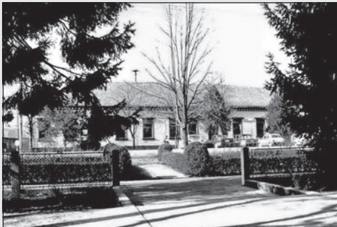
Az öreg iskola épülete a templom bejárata elől nézve