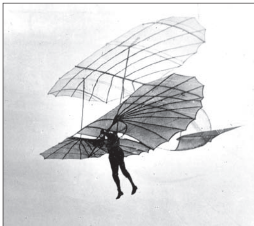
Irány a sztratoszféra (illusztráció)

alakú és méretű fogaskerekeket, valamint súlyokat. Szinte mindennaposak voltak az ilyen természetű látogatások. Egyik találkozásunk alkalmával elűjságotla, hogy most már jó úton jár, a gépezet akár magától is működne, csak még egy kis baj van a kenéssel, ugyanis a szerkezetet meghajtó energia a súrolódás folyamán elveszik. Hetekkel később elfoglaltságomból kifolyólag nem tudtam azonnal eleget tenni a tervező újabb kérésének, mondtam neki, hagyja nálam az örökmozgó papíron levő vázlatát, majd én másnapra elkészítem a szükséges rajzot. Az