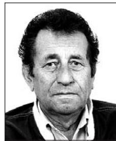
TÓTH István (1940–2017)

Elmegyek töletek, nem lehet búcsúsznom, nincs több időm, ideje indulnom. De szívetekben hagyom szeretetem örökre, ha látni kívántok, tekintsetek az égére.