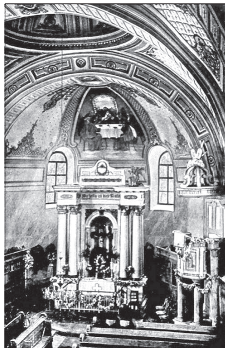
A járeki templom szentélye

A toronyórát Karl Mayer szerelte fel 1857-ben. Új oltárt csak 1869-ben készítették egy újvidéki fafaragóval 1611 forint 40 krajcárért, majd egy év múlva Pesten orgonát is vásároltak