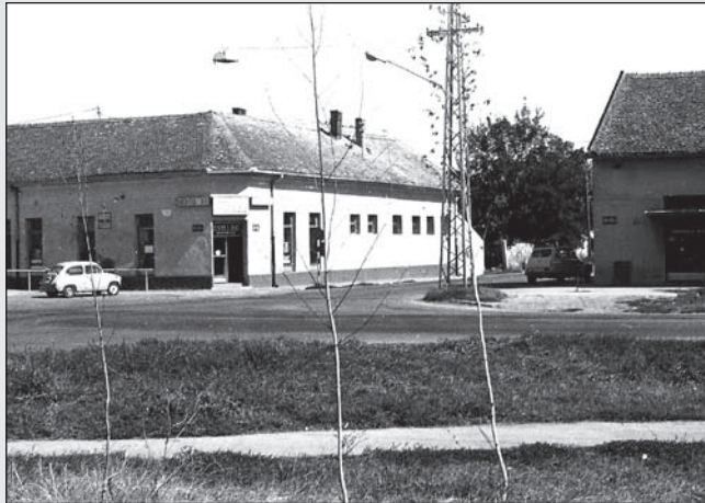
A Csillag vendéglő az 1980-as évek elején