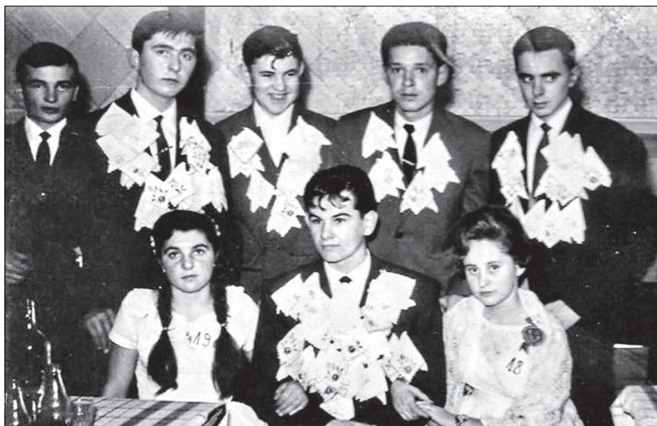
A lányok hímett fazonkendőt tűztek a velük táncoló fiúk gallérjára (Táncvizsga, 1963)