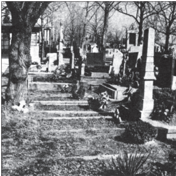
A Temerinben elhunyt katonák sírjai a nyugati temetőben 1933-ban

A háború befejezése után azonban gyorsan a feledés homályába merültek az itteniek számára ismeretlen emberek, és a sírjaikat nem gondozták. Az idő múlásával egyre siralmasabb állapotba kerültek a nyughelyek, míg végül 1939-ben a Katolikus Kör vezetőségének indítványozására megkezdték a katonasírok rendbetételét. Az említett év halottak napján a Temerini Újság a következő sorokat közölte: „A temerini temetőben, a kápolnánál balra elágazó