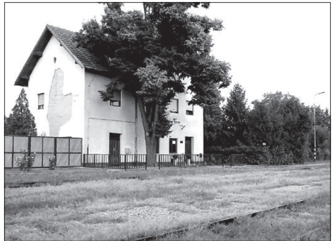
A gazzal benőtt temerini vasútállomás, 1999

Temerinben az 1950/60-as években sok diák és munkás ingázott Újvidék és Temerin között, olykor még a vagonok tetején is. A