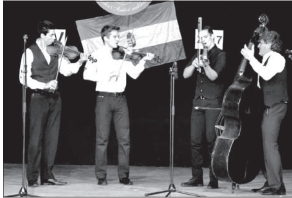
A helyi művelődési egyesület zenekara