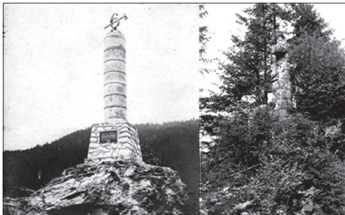
A szabadkai 6. honvédezred emlékműve Kirlibabánál egykor és napjainkban