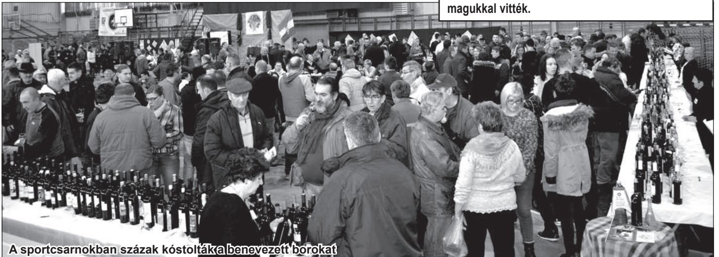
A sportcsarnokban százak kóstolták a benevezett borokat