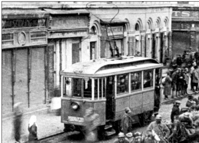
A szerb hadsereg bevonulása Újvidékre 1918. november 9-én