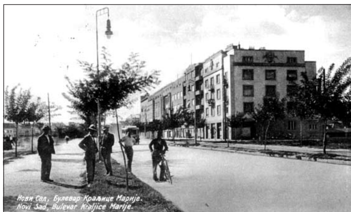
A Mária királynéről elnevezett új sugárút