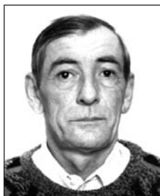
SARNYAI Imrétől (1952–2016)

Az élet egy viharos tenger, melyben csak küzd és dolgozik az ember, és mire céljára talál, csónakját felborítja a halál.