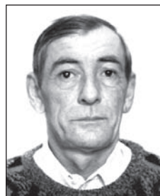
SARNYAI Imre Csiritől (1952–2016)

„Nem múlnak ők el, kik szívünkben élnek, hiába szállnak árnyak, álmok, évek!” (Juhász Gyula)