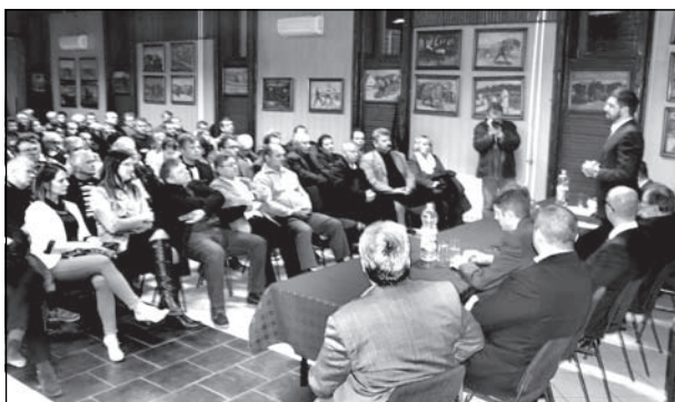
Magyar Levente a lakossági fórumon

A szép számban megjelentekhez fordulva Magyar Levente államtitkár közölte, hogy az idén elindult gazdaságfejlesztési program keretében rendelkezésre álló forrásoknak eddig kevesebb mint 1/12 része lett elkölthetve. Temerinben is vannak olyanok, akik valamilyen formában már részesültek a program áldásos hatásaiban. A munka döntő része még