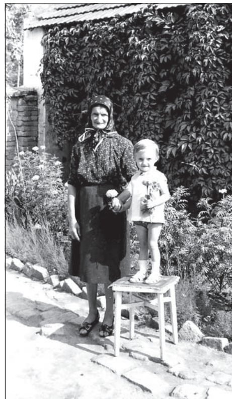
Nagymama és unokája (Banko Pál felvétele feltehetően az 1960-as évekből)

Vennék krómozott lökhárítót Golf 1-re. Telefonszám: 064/61-74-682