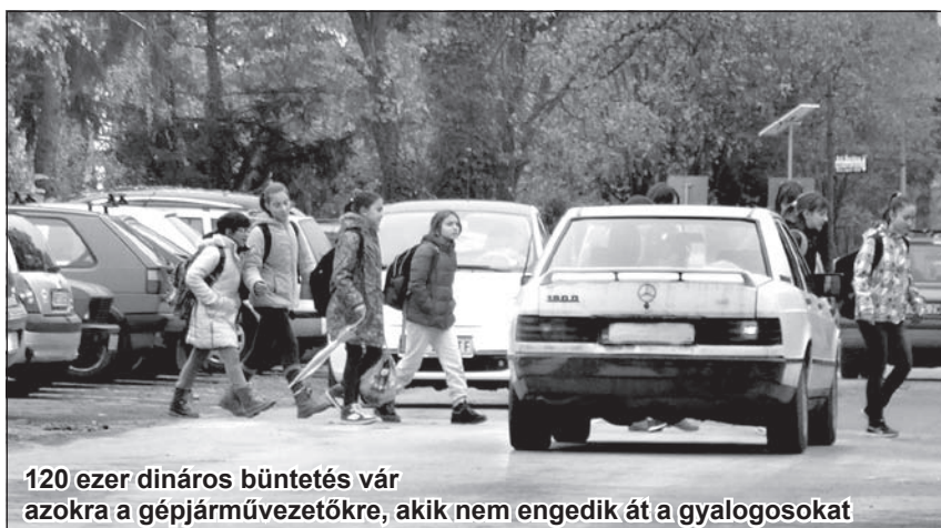
120 ezer dináros büntetés vár azokra a gépjárművezetőkre, akik nem engedik át a gyalogosokat