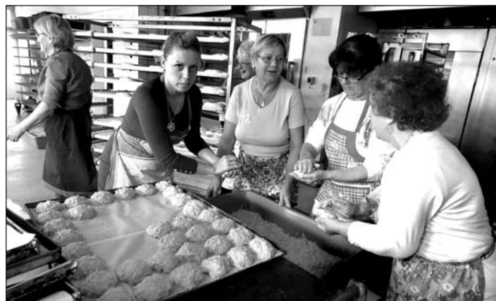
Nagymamák receptje szerint: sütés előtt tepsibe kerül a görhe