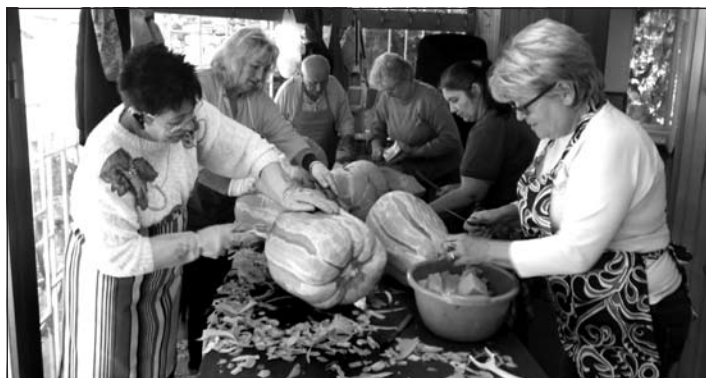
A tökök hámozása