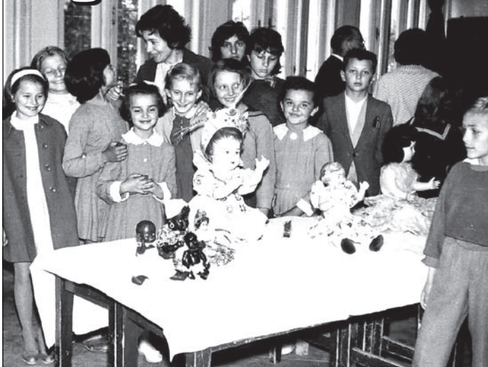
1954-es születésű kisdíjak szüleikkel és pedagógusaikkal – babakiállításon.