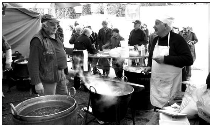
Ízletes birkapaprikás főtt a sátor alatt