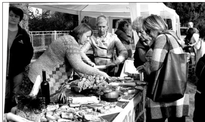
Különböző termények közül lehetett válogatni a tökfesztiválon