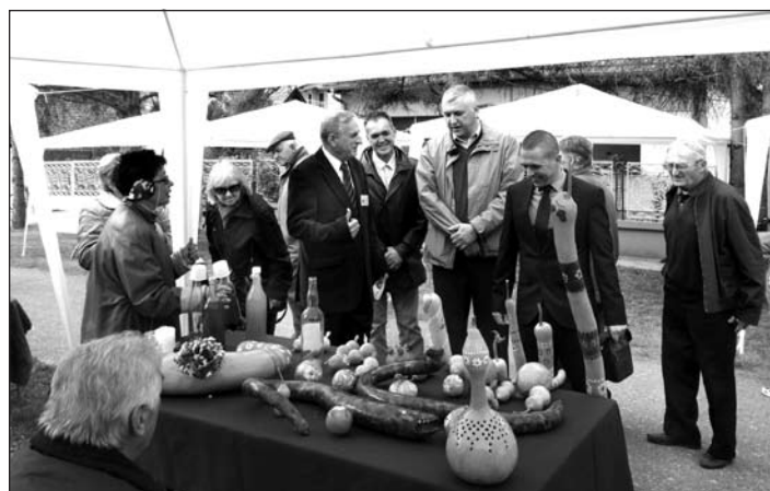
A vendégek megtekintik a kiállítást