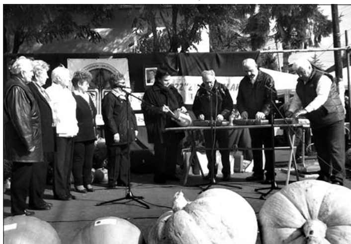
Az alkalmi pódiumról citerazene is hallatszott