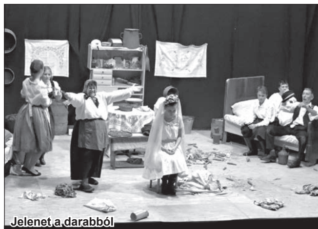
Jelenet a darabból