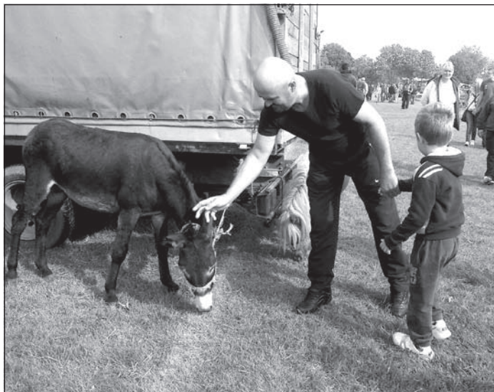
A legtöbben a csacsikat simogatták meg

A hűvös reggeli órákban több ház kéményéből is füst szállt a magasba. A fűtési szezon küszöbén kelendő volt a kéménytisztító acélsodrony nyelvű drótkefe. E nélkülözhetetlen eszköz ára az sodrony-nyél hosszúságától függően alakult. Az egyméteres sodronyra szerelt kefe ára 250, a háromméteres 400, az ötméteres 600, a leghosszabb, 12 méte-