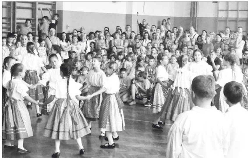
A tornateremben a negyedikesek ünnepi műsorral köszöntötték az elsősöket

A Kókai iskolában kevesebb, máshol több az elsős