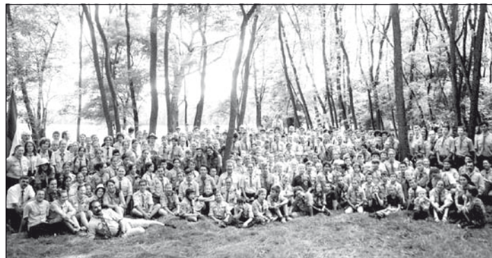
Nagyszámú részvevő volt a cserkésztalálkozón

Július első hétvégéjén került megszervezésre a Vajdasági Magyar Cserkészsövetség akadályversenye Kispiacon, ahol a különböző helységekből érkezett cserkészek mérték fel felkészültségüket cserkésztudásból, ügyességéből, tájékozódásból, elsősegélyből és magyarságismeretből. A kiscserkészek (6-10 évesek) meseerdőben igyekeztek helytállni, ahol találtak sárkányokkal, manókkal és más mese-lényekkel, akik a jól megoldott feladatokért és helyes válaszokért cserébe tovább engedték a