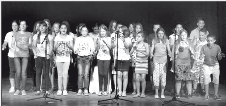
A nyelvi tábor résztvevőinek csoportja