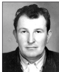
ÁDÁM János (1924–1966)