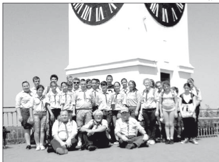
Emlékfotó a pétervárad vár tornyánál

tunk a segédőrsvezető-képző tanfolyamnak (a cserkészeink vezető-képzés első lépcsőfoka), ahol 24 vajdasági jelöltet készítettünk fel az előtti álló Erdélyi vezetőképző-táborba.