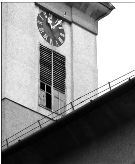
Egy lerepülő alkatrész kiütötte a torony ablaküvegét

hibásodott meg, nemrégiben pedig a harangon levő egyensúlyozó mondta fel a szolgálatot, ez okozta a különös, szokatlanul furcsa hangot. Most a balasz esett le, kiütve az iskola felé néző toronyablak üvegét. Darabjai a tetőre, onnan