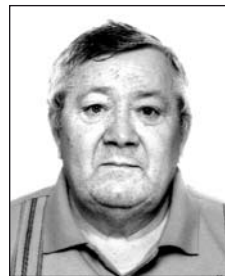
HEGEDŰS Páltól (1953–2016)