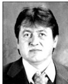
KISS Ferenc (1966–2015)