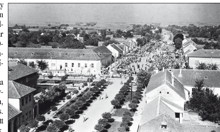
Temerin központja az 1960-as években, balról a Kalmár-ház

Apa és fia, ők ketten dolgoztak, esztergályoztak és csapágyakat is készítettek. Kerestek helyet az új üzemnek. Felajánlottam nekik a központban, a kultúrthoz udvarában levő területet, amelyen a Petőfi birtok traktorokat és más mezőgépeket tartott az ott levő garázsokban. A Petőfi igazgatóját megkértem, a traktorokat vigyék ki a másik telepükre. Itt kezdődik a temerini görgőscsapágygyár története. Nagyon gyorsan felfejlődtek, két