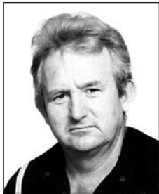
FARAGÓ László (1943–2011)

Öt szomorú éve, hogy már csak emlékeinkben élsz