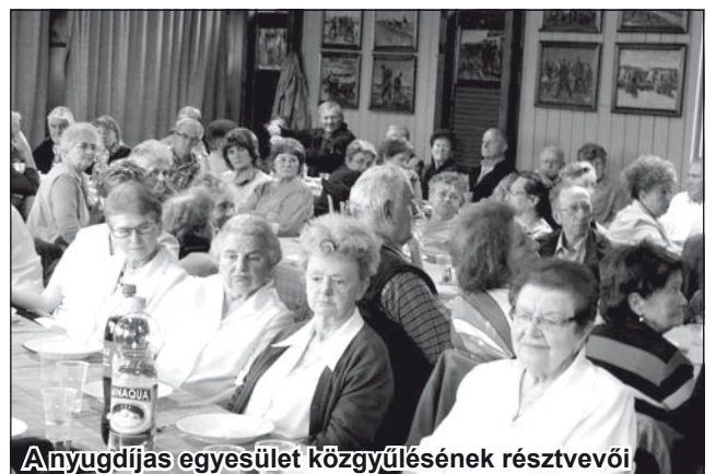
Anyugdíjas egyesület közgyűlésének résztvevői

Temerini ifjúsági bál – Mulassunk a The End zenekarral április 22-én, 21 órakor a temerini Ifjúsági Otthonban. Jegyek elővételben 200 dináros áron, a helyszínen 300 dinárért válthatók. Telefon: 063/666114, 069/1995-966