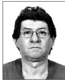
BOLLÓK János (1955–2011)

Szomorú öt éve, hogy nincs közöttünk szeretettünk