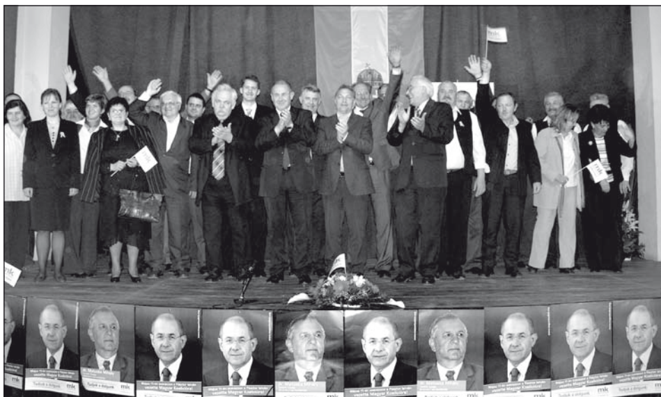
Választási kampány, 2008 májusa: a Magyar Koalíció vezetői és más közéleti személyiségek a moziterem színpadán (középen Orbán Viktor)

A 2012. május 6-án megtartott választásokon a VMSZ egyedül vett részt. Mivel a magyar kormány egyértelműen a VMSZ mellett kampányolt, a VMDP lemondott a köztársasági választásokon való részvételről. A VMDK és az MPSZ más kisebbségi szervezetekkel koalíciót alkotva indult és egy képviselői helyet szerzett, de ez a hely az aláírások zömét begyűjtő muzulmánokat illette meg. A VMSZ Pásztor István személyé-