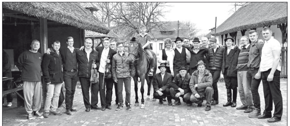
Locsolkodók a tájházban