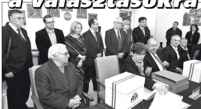
A VMSZ tartományi listájának átadása Újvidéken

A Köztársasági Választási Bizottság (RIK) március elején hivatalosan is elindította a 2016. évi előre hozott parlamenti választások folyamatát Szerbiában. Ezt követően a köztársasági parlament elnöke kiírta az önkormányzati választásokat, majd a tartományi parlament elnöke a tartományt, a községi képviselő-testület elnöke pedig a helyi közösségi választásokat. A választások a kisebb költségek miatt minden szinten egy időben, április 24-én lesznek. A kiírásokat követően kezdődtek a választásokon induló pártok és pártkoalíciók jelölt listáit támogatók aláírásainak gyűjtése. Miután megvolt a jelölt lista állításához szükséges kellő számú támogatói aláírás, a pártok igyekeztek minél előbb át is adni azokat a megfelelő választási bizottságoknak. A kevesebb támogatóval rendelkező pártok, vagy más okból kifolyólag, egyes pártok esetében az aláírásgyűjtés még a hét végén is folyt. A választási listák leadási határideje ugyanis április 8.