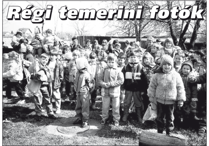
1995: Kis Györgyei Gizella és más óvónők óvodásai hazafelé tartanak.