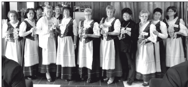
A kézimunkázó asszonyok segítették a borbírák munkáját