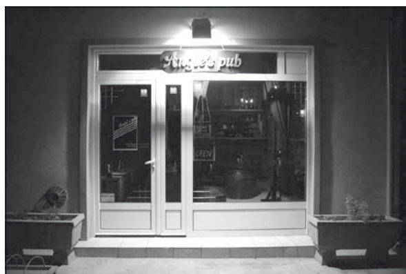
Az Angie's Pub bejárata a Kossuth Lajos utcában, az iskolával szemben

– Mivel pubról beszélünk, próbálunk úgy működni, mint egy tradicionális pub. Ami arról is szól, hogy minél több fajta sörrel kínáljuk vendégeinket. Már a nyitáskor is ez volt a törekvésünk, szeretnénk bővíteni az itallap választékát. Lesz egy tábla, amin fel lesz tüntetve a két hetente váltakozó sörfajták listája, és egy krétával lehet majd szavazni, hogy melyik legyen az a sör, amit a következő héten beteszünk a kínálatba. A vendégek ízlésének megfelelően szeretnénk megtölteni a sarkot. Emellett nagy hangsúlyt fektetünk a koncertekre. Eleinte péntekenként én és a kollégám zenélünk, később próbálunk hétköznap is be- számíthatnak a vendégek, az a hétfőnkénti blues est, ami arról fog szólni, hogy napközben blues zene szól, este pedig zenekar szórakoztatja