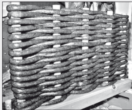
Mégis létezik: kolbászból kerítés

Ma nem kevernek annyi fokhagymát a kolbászba, mint egykoron. Inas koromban, ha olyan kuncsaft lépte át az üzlet küszöbét, aki előtte kolbászt evett, bizony megvolt a sajátos „illata”. Emlékszem