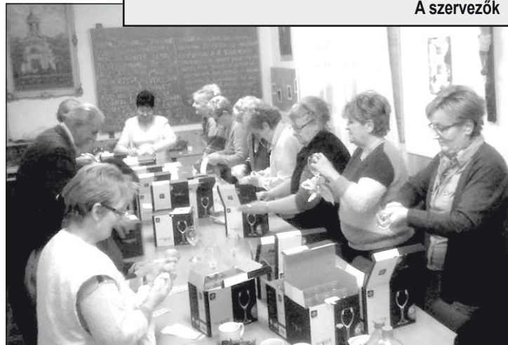
Poharak előkészítése a bírálathoz