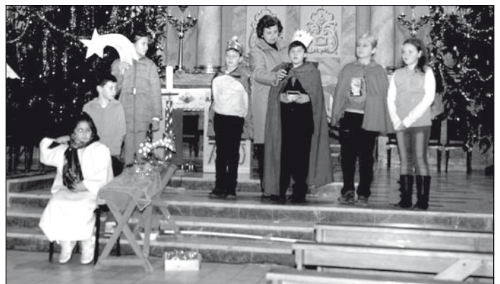
A gyerekek ünnepi műsora a karácsonyi éjjeli mise előtt