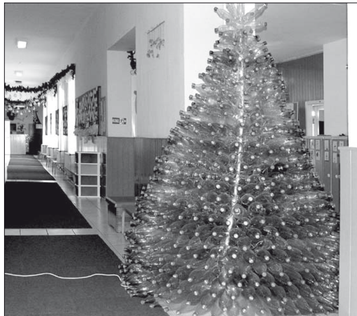
Több száz ásványvizet palackból készült a fenyőfát utánozó műalkotás

tek közre. A mű iránt érdeklődést mutatott az ásványvízgyár, amelynek termékei beépítésre kerültek. Szombaton ugyanis egy forgatócsoport kíséretében az óvodában jártak, lefilmezték a flakonfát, a gyerekek számára pedig üdítőitalokat vittek.