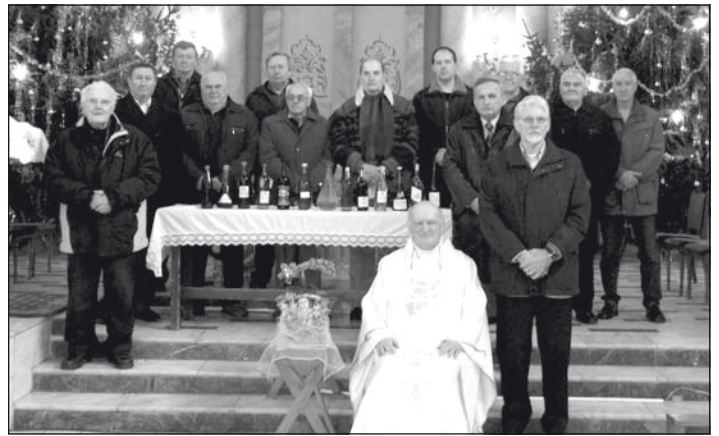
Vasárnap a nagymise keretében borszentelést tartottak. A képen a borászok egyesületének tagjai. M. S.

• ÉV VÉGI RENDEZVÉNYEK • ÉV VÉGI RENDEZVÉNYEK •