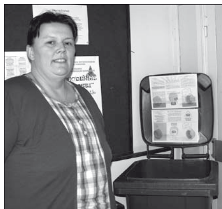
Ebbe a kukába gyűjtik az óvodások a műanyag kupakokat

A félbevágott műanyag pillepalackokat fém csőváz köré erősítették. Lentől felfelé haladva a sorokba egyre kevesebb és kevesebb palackot helyeztek, és így gúlaszerű alakzatot alakítottak ki. A rögzítést iratfűző kapcsolóval végezték. Belülre villogó égősort helyeztek, a „fenyő” csúcsán pedig dísznek szánt néhány áttetsző flakon kapott helyet. A piros kupakokat rajta hagyták a palackokon még vibrálóbbá téve az alkotás összképét.