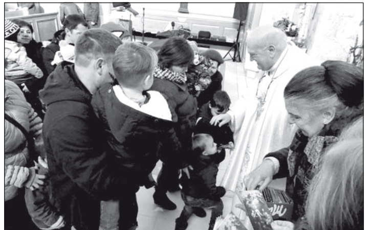
Gyermekáldás a templomban