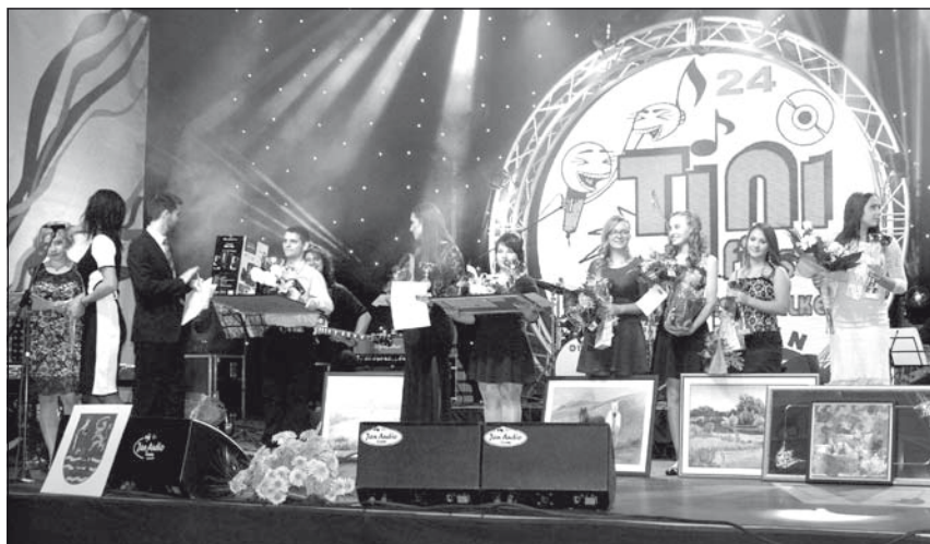
A 24. Tini és Ifjúsági Táncdalénekes Vetélkedő legjobbjai

Lezajlott a 24. Tini és Ifjúsági Táncdalénekes Vetélkedő