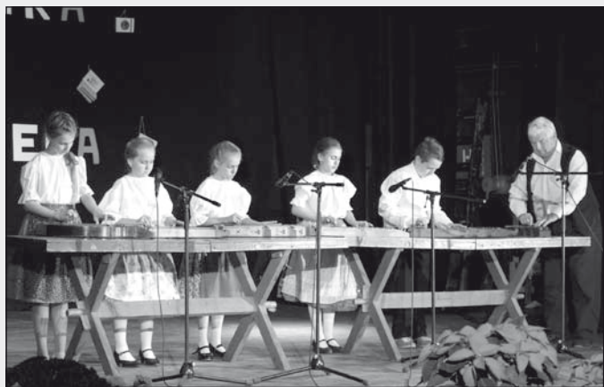
A Szirmai Károly MME gyermek citerazenekara is bemutatkozott a könyvtári évfordulók alkalmából tartott rendezvényen

A műsor elején elhangzott, hogy Temerinben a könyvtár gyökerei 1861-ig nyúlnak vissza, amikor is Temerinben megalakult az Olvasó Egylet, amiből az 1880-as évek elején kinőtt a Magyar Katolikus Polgári Kör, amely igen gazdag könyvtárral rendelkezett. A két háború között 1932-től 1941-ig a Kolónián is működött könyvtár. A második világháborút követően 1946-ban alakult meg az Ady Endre Művelődési Egyesület, amelynek könyvtára is volt. A Szövetkezeti Otthon felépítését követően 1955-ben megalakult a Népkönyvtár, amely az otthon épületének főutcai szárnyában kapott helyet. A község településeiben is alakultak művelődési egyesületek bennük könyvtárakkal. Ezek 1965-ben csatlakoztak a központi könyvtárhoz, amely egy ideig a Népegyetem keretében működött. Az intézmény negyven évvel ezelőtt vette fel Temerin szülőföldjének, Szirmai Károly írónak a nevét, majd a múlt század nyolcvanas éveiben a jelenlegi épületbe költözött, 2013 óta pedig a Szirmai Károly Közkönyvtár nevet viseli.