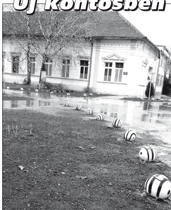
Vélemények a parkosításról, lásd a 3. oldalt