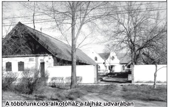
A többfunkciós alkotóház a tájház udvarában

Vasárnap, november 15-én este 7 órakor a tájház udvarában levő alkotóházban megnyílik a TAKT-kiállítás. A megnyitón az újvidéki Nemanja Mihailović dzsesszkvintett muzsikál. A közönség számára alkalom adódik közelebről megismerkedni a többfunkciós alkotóházzal. Ugyanis, mint már beszámoltunk róla, elkészült az épület tetőtere, a csigalépcső, a vendégszobák és a közös helyiségek. A TAKT vezetősége és aktivistái minden érdeklődőt szeretettel várnak a kiállítás megnyitóra.