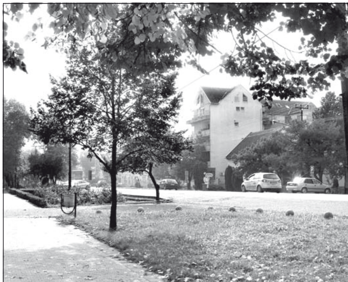
Családi ház alig-alig épül Temerinben, ezzel szemben mind többen szeretnének tömbházban levő lakásban lakni. A képen: tömbház a Kossuth Lajos és az Újvidéki utca sarkán

– Az ilyen nagyobb munkákat ma már szinte csak versenypályázaton lehet elnyerni, ahogyan