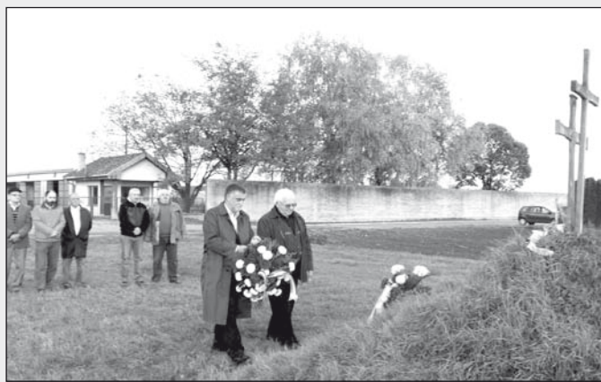
Koszorúzás a járeki haláltábor emlékhelyének halmánál