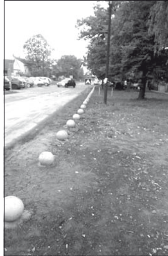
Gömbök a Kossuth Lajos és a Néprfront utcában

már az autóval érkező szülők majdnem teljes hosszal az úttesten kénytelenek megállni. Ebből eddig szerencsére nem lett nagyobb baj, noha megjegyzem, hogy például az egészségház mentőkocsijai is itt járnak el. Az óvoda Néprfront utcai szárnya elé is gömbök kerültek. Továbbá: a volt FEM vállalat kis parkolóját is körülkerítették, és a folytatásában vizesárkot ástak ott is lehetetlenné téve a kis óvodásokat szállító szülőket/nagyszülőket számára a parkolást. Egyetlen hely maradt, ahol az ember megállhat kocsival, az egészségház parkolója a Kossuth Lajos utcában, de ott csak kevés jármű fér el, és már reggel tele van. Nem értem, miért volt szükség erre, hiszen naponta több száz óvodást visznek-hoznak a szülők. Parkolót találni eddig sem lehetett, de ahelyett, hogy ezt megoldották volna, hiszen közérdek, tovább fokozták a bajt.