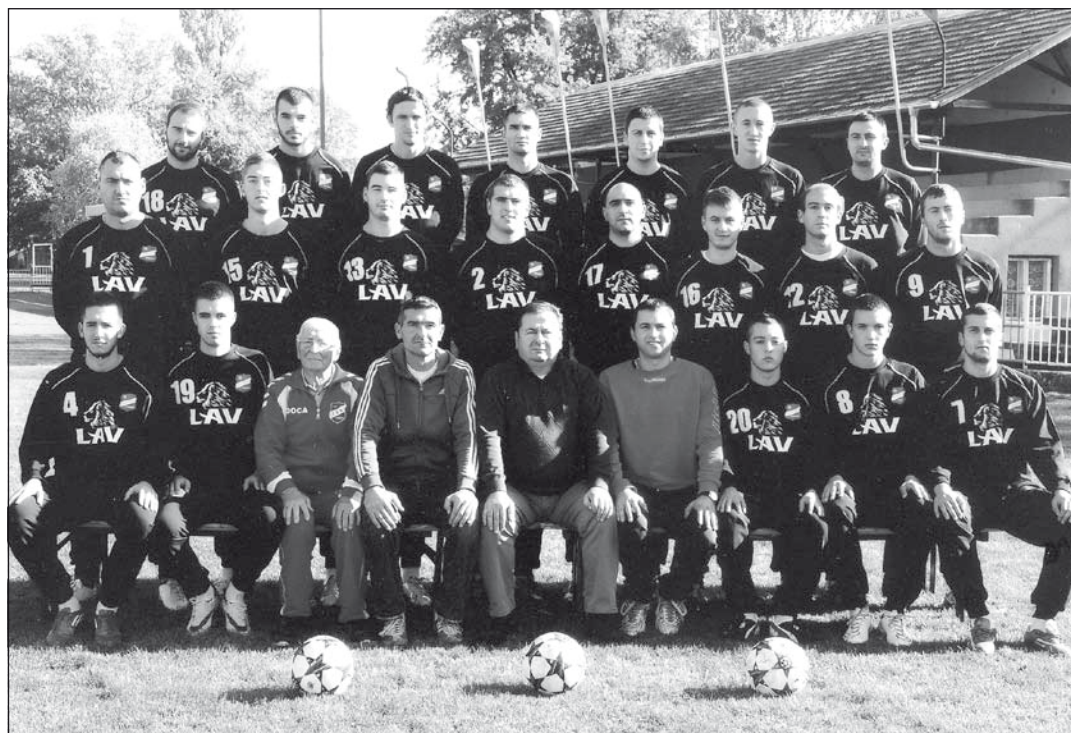
Mint már korábban jelentettük, a TSK első csapata községi pályázaton sportfelszerelést nyert. A képen a labdarúgók első csapata az új felszerelésben.