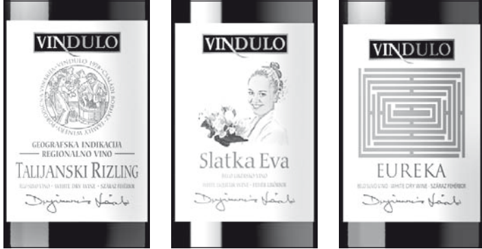
Bronz, ezüst, arany, a Vindulo három érmes borának címkéje

Három borral nevezett be a Srpsko vino gazdasági társaság által Belgrádban megrendezett szerbiai országos versenyre a temerini Vindulo Borház és Pincészet, és a mintegy 100 minta konkurenciájában – mindhárom dobogós helyet szerzett. A Vindulo olaszrizling 81,00 ponttal bronz, az Édes Éva 82,80 ponttal ezüst, az Eureka pedig 85,60 ponttal aranyérmert nyert. A Nemzetközi Szőlészeti és Borászati Szervezet (OIV) által javasolt 100 pontos bírálati rendszerben a bronzéremhez legalább 79, az ezüsthöz legalább 82 az aranyéremhez pedig legalább 85 pontot kell begyűjtenie az itálnak. A versenyen 27 bronz, 25 ezüst és 8 aranyérem talált gazdára.