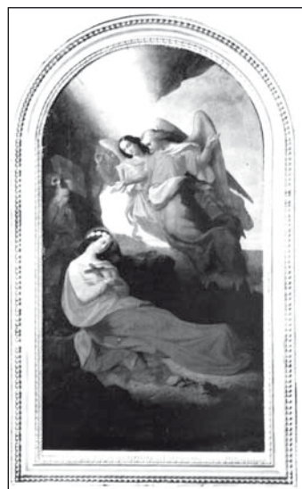
Szent Rozália-oltárkép, Hans Till festménye, 1861

védőszentjének nevében és oltárképében jutott kifejezésre, hanem abban is, hogy a 390 kilogrammos kisharangot 1839-ben a palermói szűzről nevezték el. Sorsa viszontagságos volt: 1848-ban a védelmére bízott mezővárossal együtt pusztították el. Később, nyugodtabb időkben, a temerini újraöntötték, azonban 1916-ban a K.u. K.-hadvezetés – a Szentháromság tiszteletére szentelt nagyharang kivételével – másik két társával együtt elvitette ágyúnak. A mai kisharang 1925 óta szolgálja híveit. •