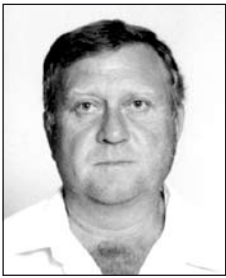
TÁPAI András (1952–2008)

Fájdalomban eltelt hét éve, hogy elvesztettük szerettünket