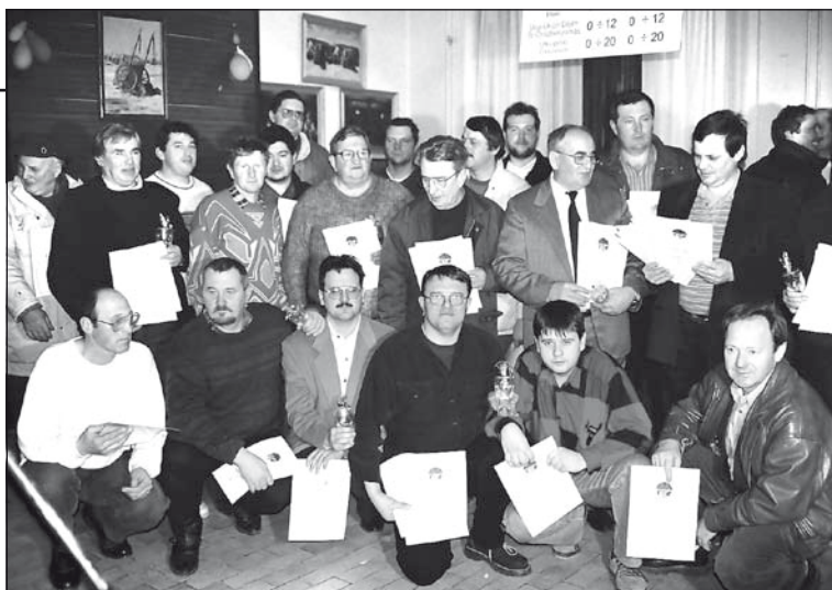
A 20 éves Temerini Újság archívumából: a II. Vince-napi Borkóstoló díjazottjai (1999)

A mintákat szombaton, január 10-én bírálják el, majd egy hétlet később, január 17-én lesz a nyilvános kóstoló és az ünnepélyes eredményhirdetés. A fesztivál keretében az idén is megtartják a hazai és külföldi egyesületek találkozóját.