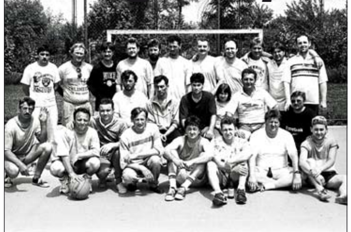
A képen látható vadligás csapat tagjai az 1960 utáni években születtek. A Temerini Újság archívumából származó felvétel az 1980-as évek közepén készült.

Saját kategóriámban országos bajnok voltam tavaly és tavalyelőtt is. Szerencsére egyre több verseny van Szerbiában, és mondhatom, hogy egyre népszerűbb nálunk az íjászat, különösen Vajdaságban.