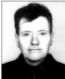
FUSZKÓ Károly (1925–1999)

Kérjük tisztelt hirdetőinket, hogy hirdetéseiket szíveskedjenek legkésőbb hétfő délután 4 óráig hirdetésgyűjtőinknél vagy a szerkesztőségben leadni.