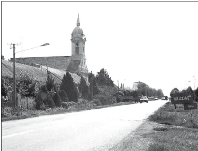
Temerini főutca, 1980-as évek, archív

Örömmre szolgál azonban, hogy működnek a magyar intézményeink. Nem túl sok van belőlük, de vannak közöttük nagyok jók is. Fontossági sorrend nélkül megemlíthető a művelődési egyesület, a Kertbarátkör, az Iparosok és Vállalkozók Egyesülete, a TAKT, a női egyesületek és mások. Kérdés, hogyan lehet fenntartani őket, és biztosítani számukra az alapvető működési költ-