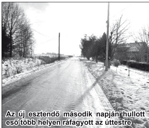
Az új esztendő második napján hullott eső több helyen ráfagyott az útestre

Ezen a héten ismét lehűlés várható. Akár mínusz 17 Celsius-fokig is csökkenhet a hőmérséklet. Hétfőn még Szerbia északi részén többnyire napos idő uralkodott, a hőmérséklet valamivel 0 Celsius-fok felett maradt, de sehol sem haladta meg a 3 fokot. A térségiünket elérő felhőtömb miatt a következő napokban 5-7 fokkal csökken a hőmérséklet.