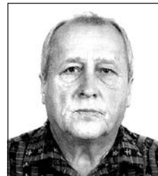
MORVAI Vince (1950–2014)