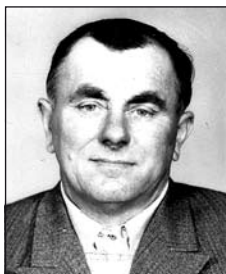
VARGA Jánost (1918–1989)

December 19-én és 22-én lesz 25 éve, hogy elvesztettük szeretteinket