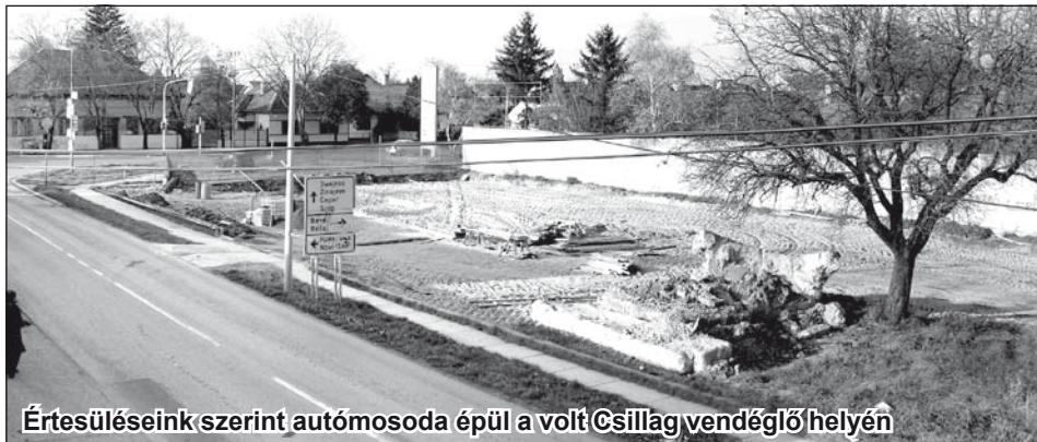
Értesüléseink szerint autósodája épül a volt Csillag vendéglő helyén

Forrásmunkák: • Az Osztrák-Magyar Monarchia írásban és képben, VIII. kötet • Gadics Ferenc: A Bácska, Budapest, 1901. • Dr. Branislav Bukurov: Geomorfološke crte Južne Bačke zbornik radova SANU, Beograd, 1953. • Bácsvármegye a XIV. század elejéig (jelzés nélkül)