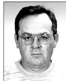
GŐZ László (1956–2008)

Mint lenyugvó nap, úgy távozik az élet, mint gyors folyó rohannak az évek.