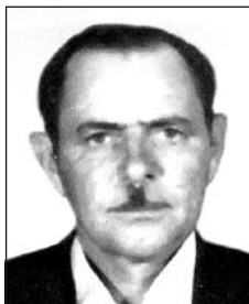
id. GŐZ József (1928–1993)