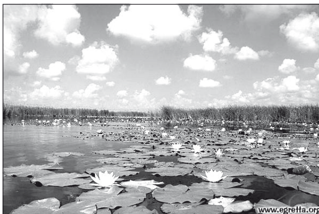
Vízililiomok a Jegricskán

Majdnem hatvan év elteltével, az 1870-es években épült a Ferenc József (Kis)-csatorna.