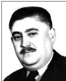
ÁBEL Nándor (1910–1965)