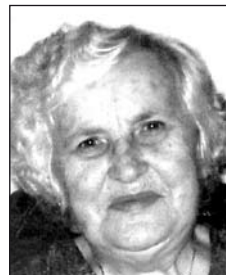
KALUDEROVIĆ ILLÉS Margittól (1929–2014)