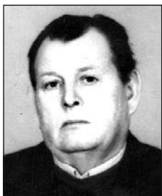
IGRÁCSKI Ferenc (1930–2013)

Az élet sora hosszú és nehéz, a feledéshez egy élet is kevés.