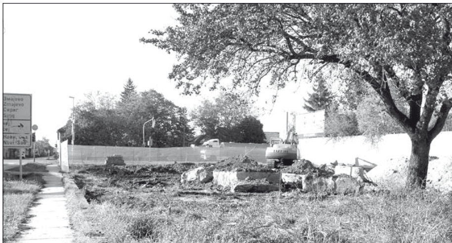
Körülkerítették és földmunkálatokat kezdtek a volt Csillag vendéglő helyén

– A dohányzás szigorú szabályozásán gondolkodnak Szerbiában. A szakemberek szerint a négy évvel ezelőtt meghozott törvényt szigorítani kellene, mert még így is dohányzik a felnőtt lakosság több mint harmada, a fiatalok 13 százaléka. Tervezik, hogy közterületeken teljesen betiltják a cigarettázást. A vendéglátóipari létesítmények tulajdonosai azt mondják, mindig többen vannak a dohányzó részlegben, ezért félnek, hogy a törvény szigorításával elmarad a vendégek többsége. A dohányosok szerint a törvénymódosítással diszkriminálnák őket, és nem hajlandók bemenni olyan helyre, ahol nem élhetnek szenvedélyüknek. (Szerbiai RTV)