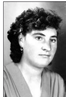
KOMISZÁR Ilonától (1945–2014)