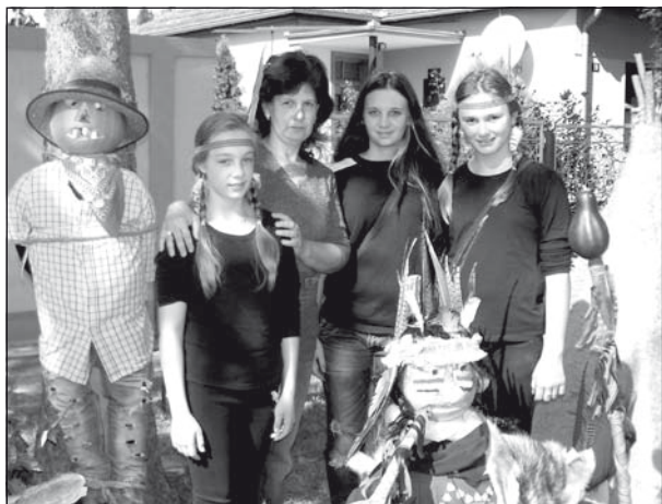
A Tökjő Apacs Csapat