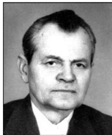
SIMON Jánostól (1928–2014)

Nem foghatjuk már dolgos két kezéd, nem simogathatjuk öszülő fejed.