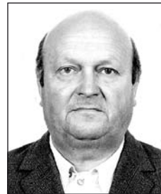
HÉVÍZI János (1930–2009)