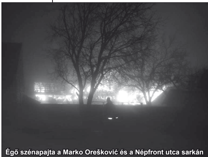
Égő szénapajta a Marko Orešković és a Népfront utca sarkán

Az újvidéki rendőrség közlése szerint a múlt pénteken fél 7-kor tűz pusztított egy temerini egyéni termelő udvarában. A tüzet minden bizonnyal egy meghibásodott, szétpukkanó villanykörte okozta. A helységben 300 bála széna, 1900 bála szalma és kukoricaszár volt elraktározva. Személyi sérülés nem történt, de a kár tetemes, mintegy egymillió dinár. A tűzben elpusztult 8 tenyészbika, sertések és kecskék. A temerini és újvidéki tűzoltóknak sikerült lokalizálniuk a tüzet.