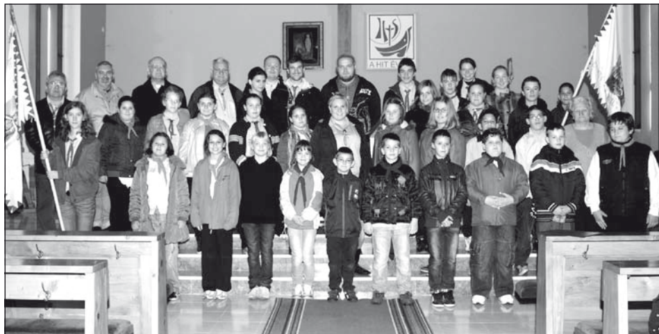
A jubiláris ünnepség résztvevői