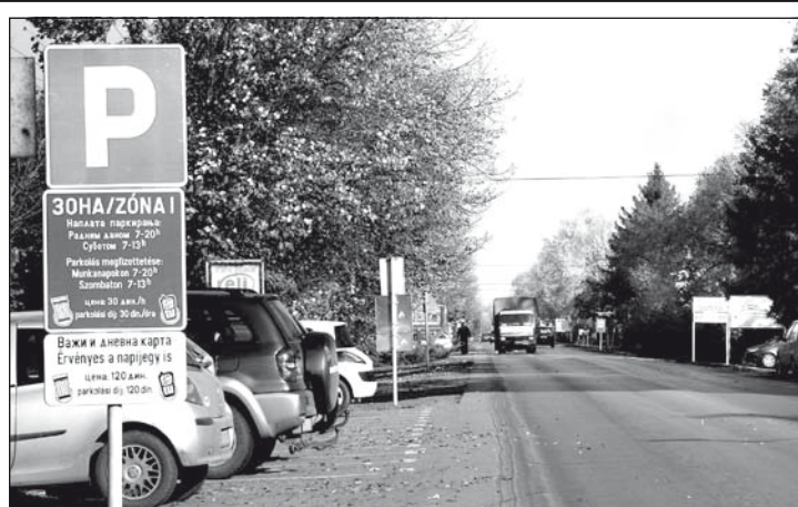
Az elmúlt napokban kihelyezték az új fizető-parkolóhelyeket megjelölő táblákat. A parkolási díjat december 1-jétől fizettetik meg.