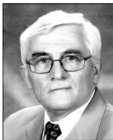
DÁVID Józseftől (1944–2013)

Tied a csend, a nyugalom, mienk a könny, a fájdalom.