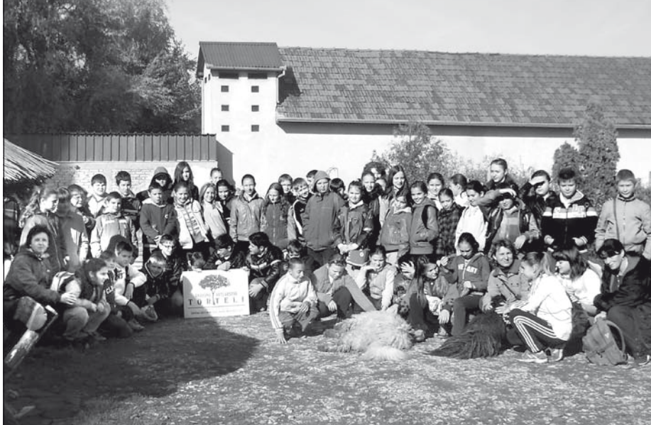
A Kókai Imre Általános Iskola 5. a, 5. b, 5. c és a 6. a, 6. b osztályainak tanulói és kísérő tanárai a természetvédelmi óra keretében a Törteli Dísznövénykertészetbe kirándultak. Ezúton mondanak köszönetet a kedves fogadtatásért.