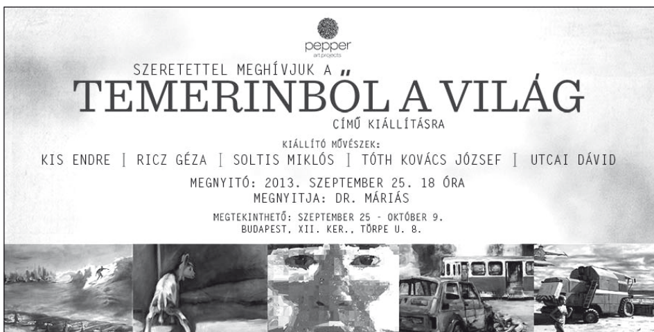
A TAKT művészei budapesti kiállításának plakátja