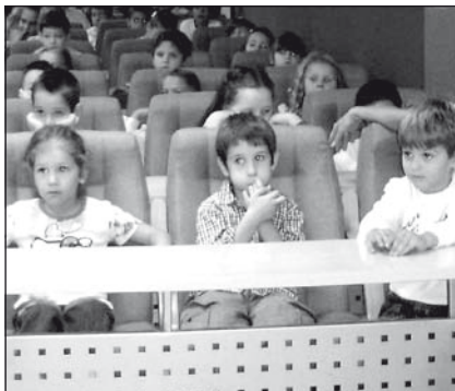
A polgármester az idén is fogadja a gyerekeket

Az Oktatási Minisztérium rendelete értelmében ugyanis a gyermekhét csakis októberben tartható. Mivel a minisztériumi utasítás és a gyermekhét-re vonatkozó írásos anyag késve érkezett, a temerinek úgy gondolták október első hetéhez tartozik szeptember