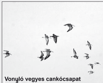
Vonuló vegyes cankócsapat