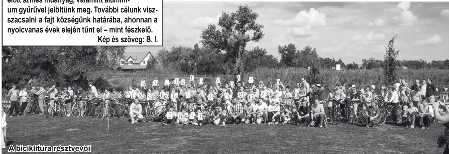
A biciklitúra résztvevői