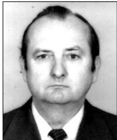
id. GLESSER Ferenc (1927–2013)