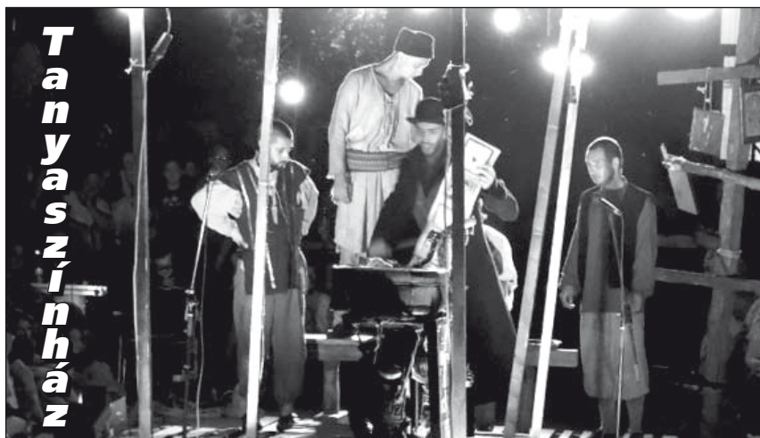
A múlt pénteken a telepi iskola udvarában vendégszerepelt a Tanyaszínház Tadeusz Słobodzianek Ilja próféta című darabjával

Az egyik újdéki televízió kép alatti mozgófeliratban azt javasolta, minden gyanús esetben azonnal hívni kell a rendőrséget (192), és nem árt óvatosnak lenni!