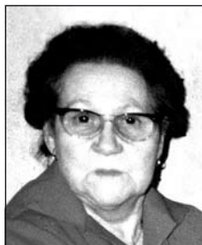
KOVÁCS Margit (1919–2010)

Múló a világ, virágs le hull, csillag leesik, minden megavul, legszebb örömrünk vígnapja lesz áll, mindent megemész a sír, a halál. De túl a síron, ezt vallja hitünk, valódi hazánk partján kikötünk.