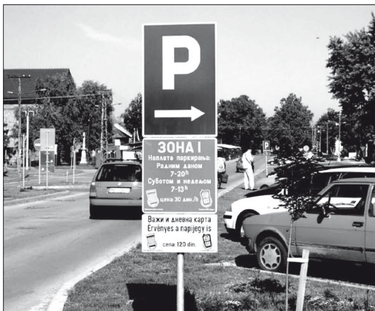
A fizetős parkoló tájékoztató táblája szerb nyelven cirill írásmóddal készült. A magyar szöveg csak a pót-táblán olvasható. G. B.

A helyszínen a VMSZ temerini szervezetének elnökétől megtudtuk, hogy az ügyben illetékesekkel való beszélgetésből kiderült, megértették a problémát, és remélhetőleg hamarosan a táblák cseréjére is sor kerül.