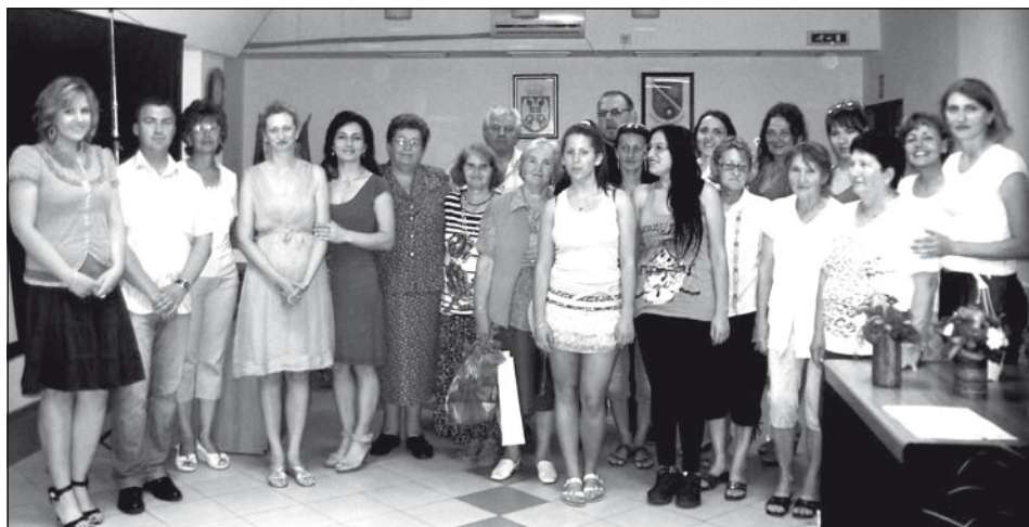
A legrendezettebb udvar elnevezésű községi verseny résztvevői a díjkiosztón

számításba vettük a ház előtti, az utcai terület rendezettségét is. Az udvaron belül alaposan szemügyre vettük, hogy a növényeken kívül hogyan rendezték el az utakat, hogyan illesztették be a környezetbe például a csobogót, a rostély-sütőt, mennyire olvad be a környezetbe a terasz. Egyszóval mennyire és milyen összhangban van az egész udvar, milyen az esztétika és a funkcionális harmóniája.