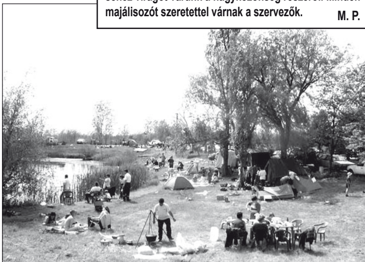
Régi majális a Jegricska partján