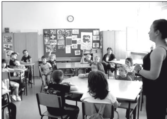
Foglalkozási óra az iskolába induló óvodásokkal

– Célunk az, hogy felhívjuk a figyelmet az