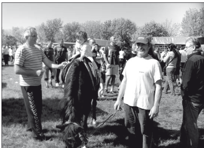
Aki idejében megüli a lovat

Nagy volt az állatvásár, malacot azonban csak néhány helyen árultak többnyire viszonteladók. A márciusi vásár óta megdrágult a malac. Az akkori 240-250 dináros kilónkénti árral szemben, most 300 dinárt kértek az árusok. Több helyen kínáltak bárányt, birkát és kecskét is. Legnagyobb forgalmuk mégis a bárányárusoknak volt. A májusi ünnepek előestéjén úgy vitték a bárányt, mintha ingyen osztották volna. A magánszemélyek általában egyesével, de a vendéglősök többsével vásároltak, és különként 250 dinárt fizettek a jószágért elősúlyban. A birkák kilója 220-230 dinár volt. Egy kisbárányt általában nagyságtól függően 3000-5000 dinárért vásárolhattunk. Kecskét 5000-6000 dinárért vehettünk, szamarat pedig 320 euróért. A vásár végéig sem cserélt gazdát a csacsi. A vágásra szánt lovak kilója egy euró körül mozgott. A borjak ára kortól, nemtől és nagyságtól függően 250 és 400 euró között alakult. Rengeteg volt a lábasjószág: a kiscsirke 40-60, a kiskacsa 120-250, a kisliba 300-450 dinárba került. A kismulák 300-500, míg a süldőmulák 1000 dinárba kerültek. A terrier kiskutyáért 1000, a puliért 1500 dinárt kértek.