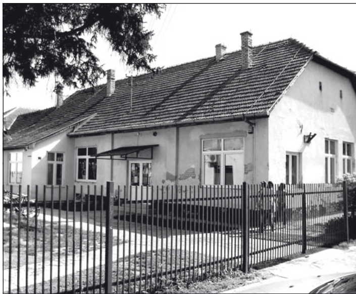
A telepi iskola épülete

– A tavalyi év végén tervezett 6 millió dinárt tervrajzokra költöttük, az építkezésre megközelítőleg 5,3-5,5 millió dinár maradt. A községi költségvetés módosítása révén még megtoldhatjuk valamennyivel ezt az összeget. A következő lépésben tervezett munkálatokat már a következő évi költségvetésből finanszíroznánk. Egyelőre csak községi költségvetési eszközök állnak rendelkezésre, de forrásokhoz juthatunk a Nagyberuházási Alap pályázatán is.