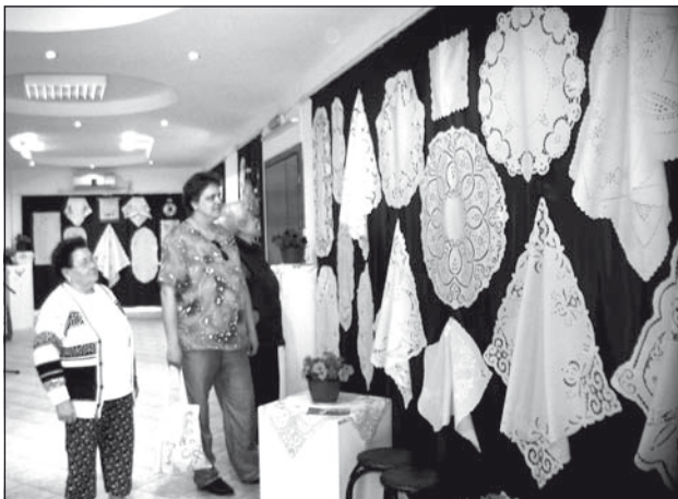
A fehérhímzést mindig megcsodálják a látogatók

– A szakkör tagjai 12 évig egyidejűleg a Kertbarátkörnek is tagjai voltak. Hat évig nem volt saját folyószámlánk, attól kezdve pedig volt,