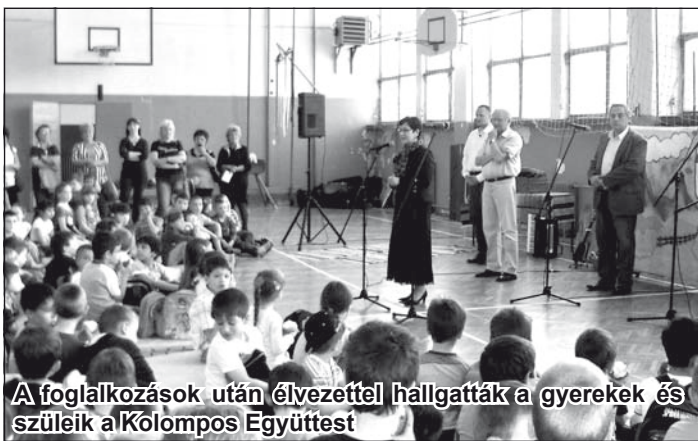
A foglalkozások után élezzettel hallgatták a gyerekek és szüleik a Kolompos Együttest