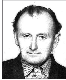
TÓTH István (1925–1992)