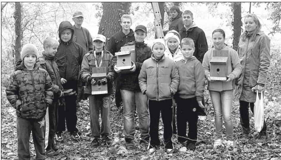
A lelkes fiatal természetvédők, és vezetőik

Az akcióban kilenc iskolás és néhány felnőtt vett részt, kiket a sikeres munka elvégzése után meleg tea és rágcslálnivaló várt a kertészlakban.