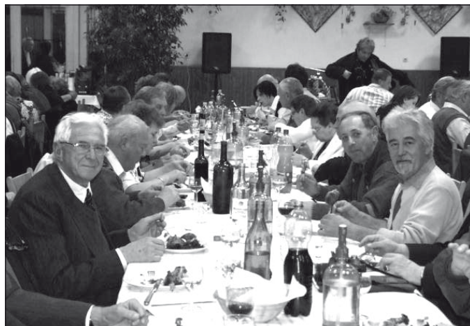
A Temerini Kertbarátkör november 9-én a kertészlakban az idén is megszervezte a hagyományos Márton-napi újborkóstolót. Másnap egy csoport Bicskére utazott az ottani kertbarátkör Libatori újborkóstoló elnevezésű rendezvényére.