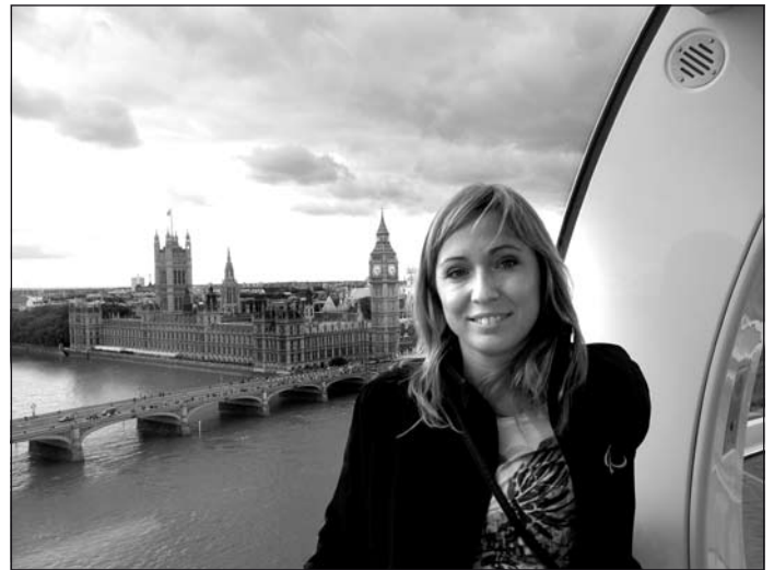
Londoni látkép a nagykerékről

– Életem egyik legszebb három napját tölthettem 2005-ben Barcelonában, ahol a világ legjobb sportolóinak adták át a Laureus-díjat. Én egy magyarországi kerekesszékes vívót kísértem el oda. Egy ötcsillagos tengerparti hotelben a hírességekkel együtt szállásoltak el bennünket. Magán az ünnepségen is csillogott-villogott minden, ezért is hívják a Laureus-díjátadást a sportolók Oscarjának. Vörös szőnyegen kellett végigvonnunk, a fotósok kedvéért meg kellett