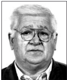
KURILLA Mihály (1941–2012)