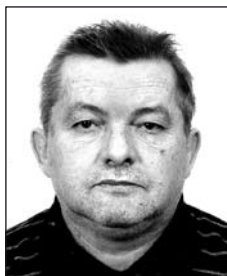
KATONA Szilvesztertől (1954–2012)

„Van egy szó, van egy hang, nem hallom rég, akárhogy keresem, megfakult kép. Csak egy perc, csak egy szép fáradt álom. Van egy szó, van egy hang, nem találom.”