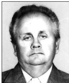
PÁLINKÁS Imre (1932–2011)

Bennünk él egy arc, egy meleg tekintet, egy simogató kéz, egy sóhaj, egy lehelet. Bennünk él a múlt, egy végtelen szeretet, amit tőlünk soha senki el nem vehet.