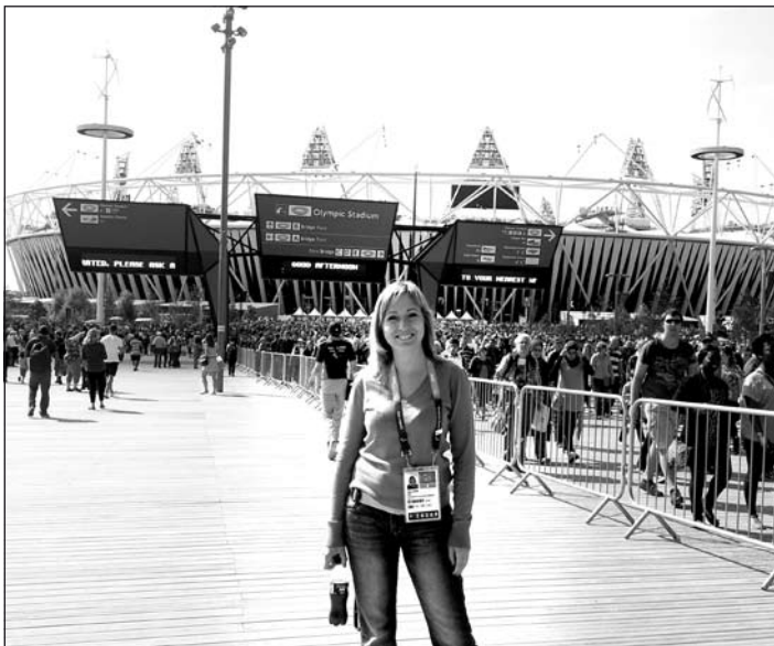
Londonban az olimpiai stadion előtt

Elavult és használhatatlan állapotban levő számítógépeket és alkatrészeket vásárolok.