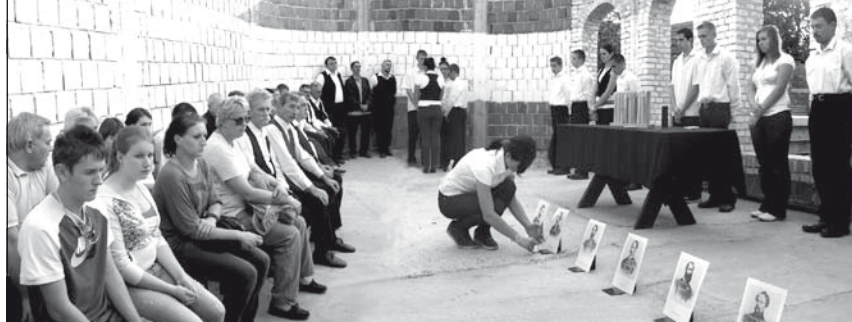
Jelenet a kaposvári tanulók műsorából

Október 6-án, szombaton délután négy órai kezdettel a tájház udvarán az épülő galéria nagytermében a Szirmai Károly Magyar Művelődési Egyesület férfikara és a Délvidéken tanulmányi körúton tartózkodó kaposvári mezőgazdasági középiskola tanulói alkalmi műsor keretében emlékeztek a magyar forradalom és szabadságharc vértanúira. A nagyobb közönség részvételt megérdemlő nemzeti gyásznapunk történelmi eseményeit felidéző, kiválóan megszervezett előadás kiváltotta a jelenlévők nyíltzíni elismerését.