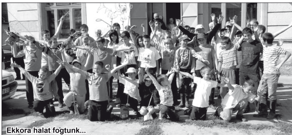
Ekkora halat fogtunk...